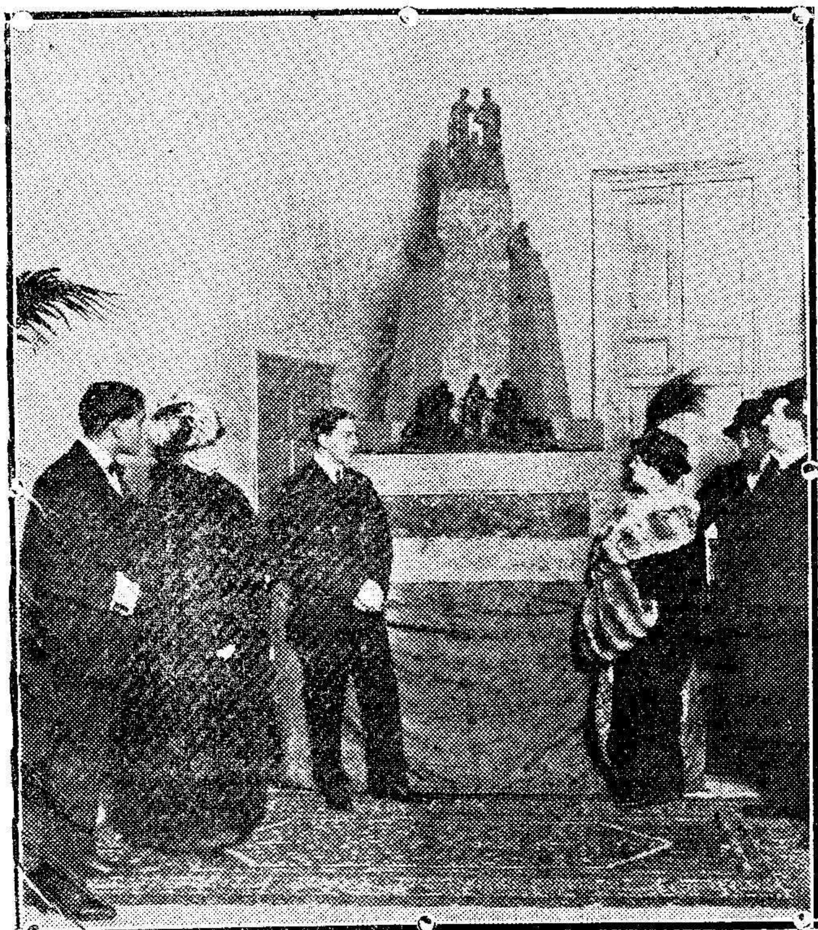
Su Alteza la Infanta Isabel, en su visita al estudio de los escultores Sebastián Miranda y Julio Antonio, contemplando el proyecto de monumento a las Américas.

Anoche tuvimos el gusto de saludarles. Sean bien venidos.