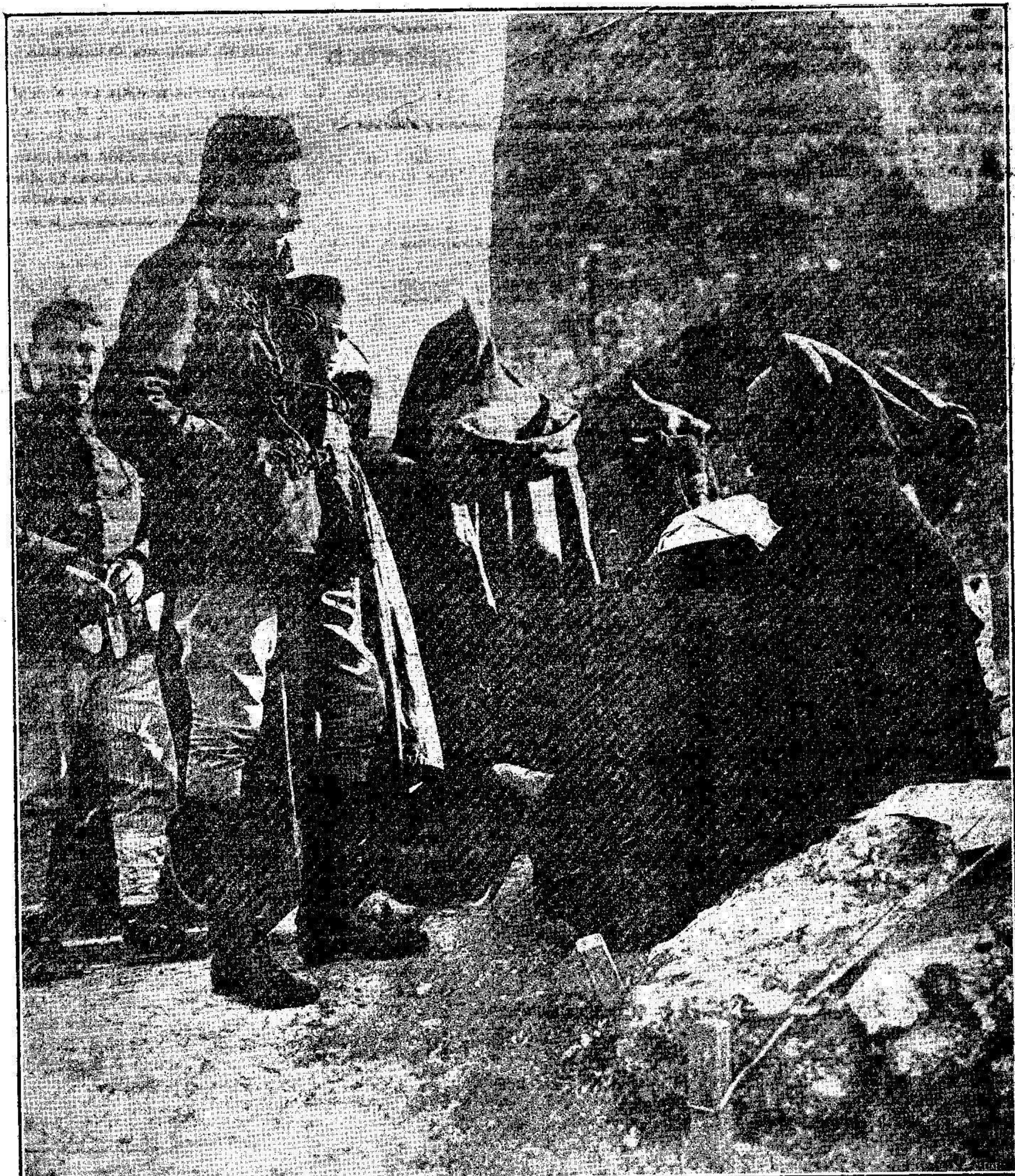
Consulta médica en Tetuán.

No es aventurado asegurar que el pueblo de Melilla que en todas ocasiones ha dado prueba de sus nobles sentimientos, concurrirá hoy al Kursaal con objeto de mitigar en parte la precaria situación de las desgraciadas familias de los naufragos.