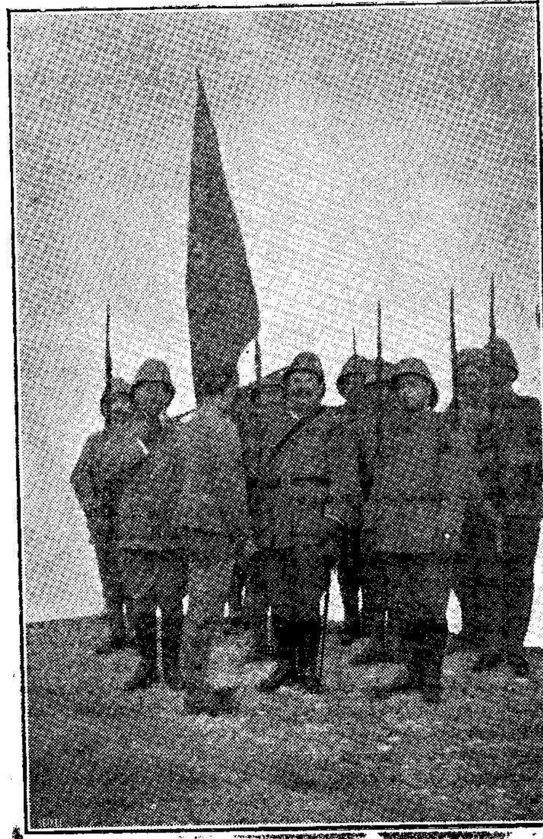
Soldados de la Brigada Disciplinaria en el acto de la Jura de la Bandera.