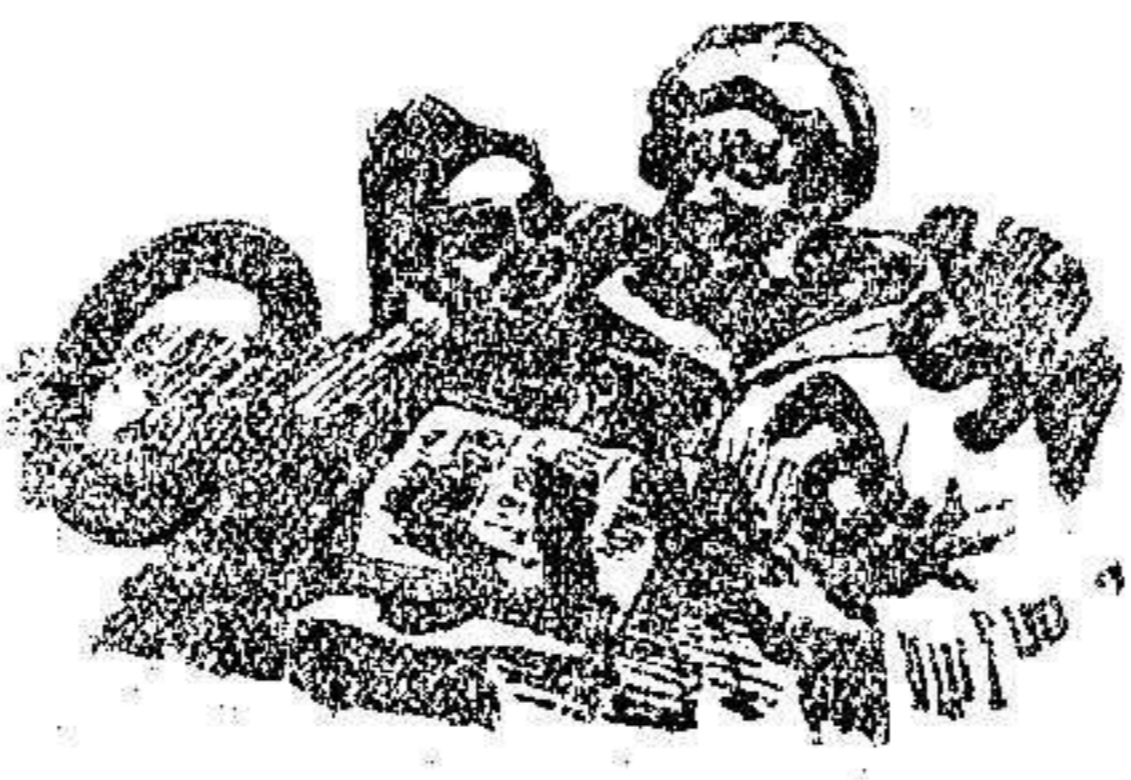
Hay que impedirlo

Aun admitiendo las gestiones relativas á casos como los de los vapores «León XIII», «Ciudad de Cádiz», «Ragesanti», «Santa Cruz» y otros varios, en que se obtuvo el levantamiento de embargos de mercancías y la devolución de las desembarcadas, el Sr. Dato me enseña una lista,—dice Dario Pérez—que todavía, sobre ser extensísima, califica de incompleta, y muestra lo que, en otros aspectos del incómodo problema mercantil planteado por la guerra, ha hecho el Gobierno para atender á las demandas de la industria y el comercio español.