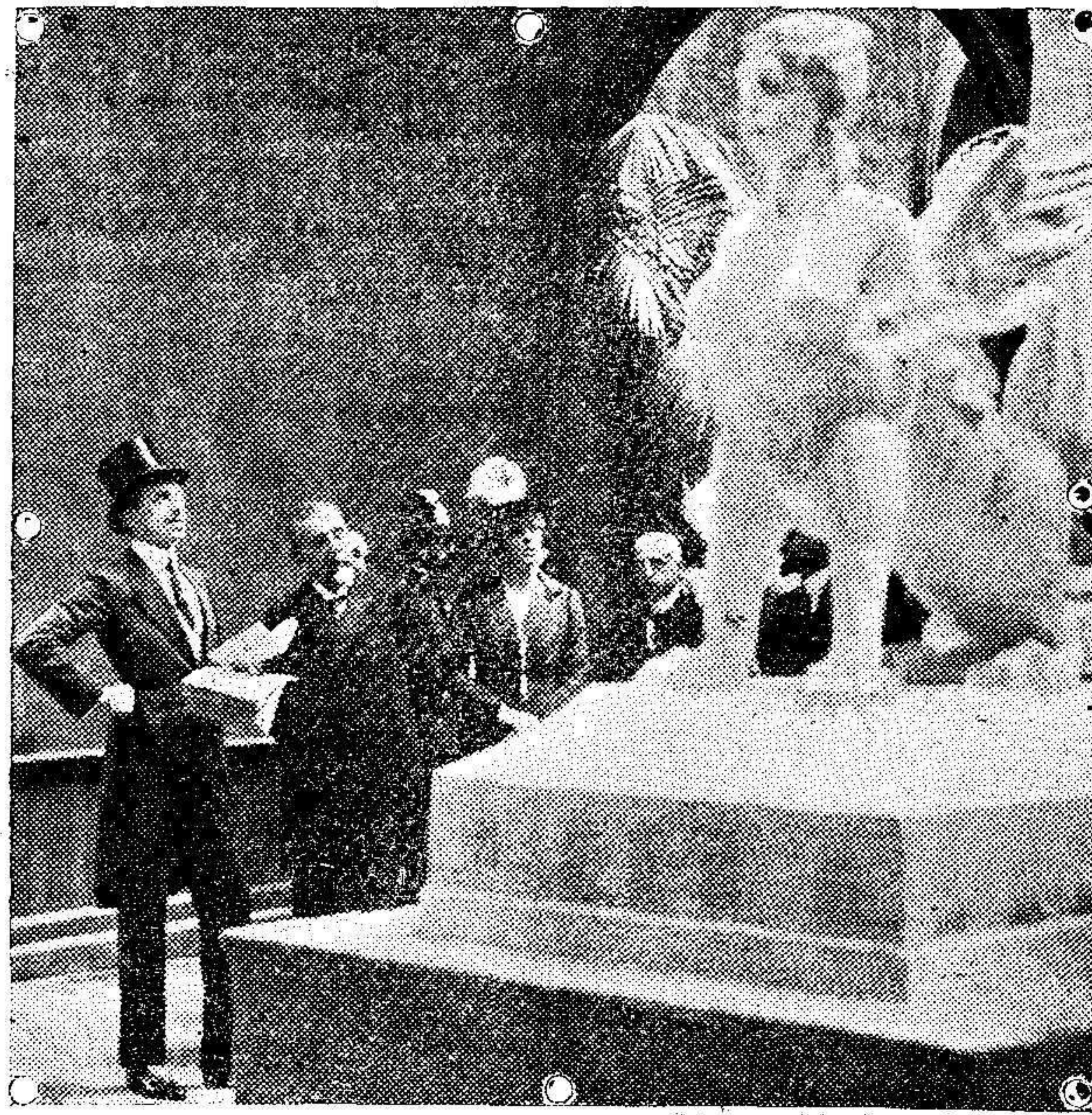
Sus Majestades Don Alfonso y Doña Victoria viendo uno de los proyectos del monumento á Cervantes.

Yo no sé si algún caso de tifus se habrá registrado, puesto que el tifus existe en todas partes. Pero de esto á decir que de repente surgen 2.800 invasiones epidémicas, hay una diferencia tal, que no sé como calificarla.»