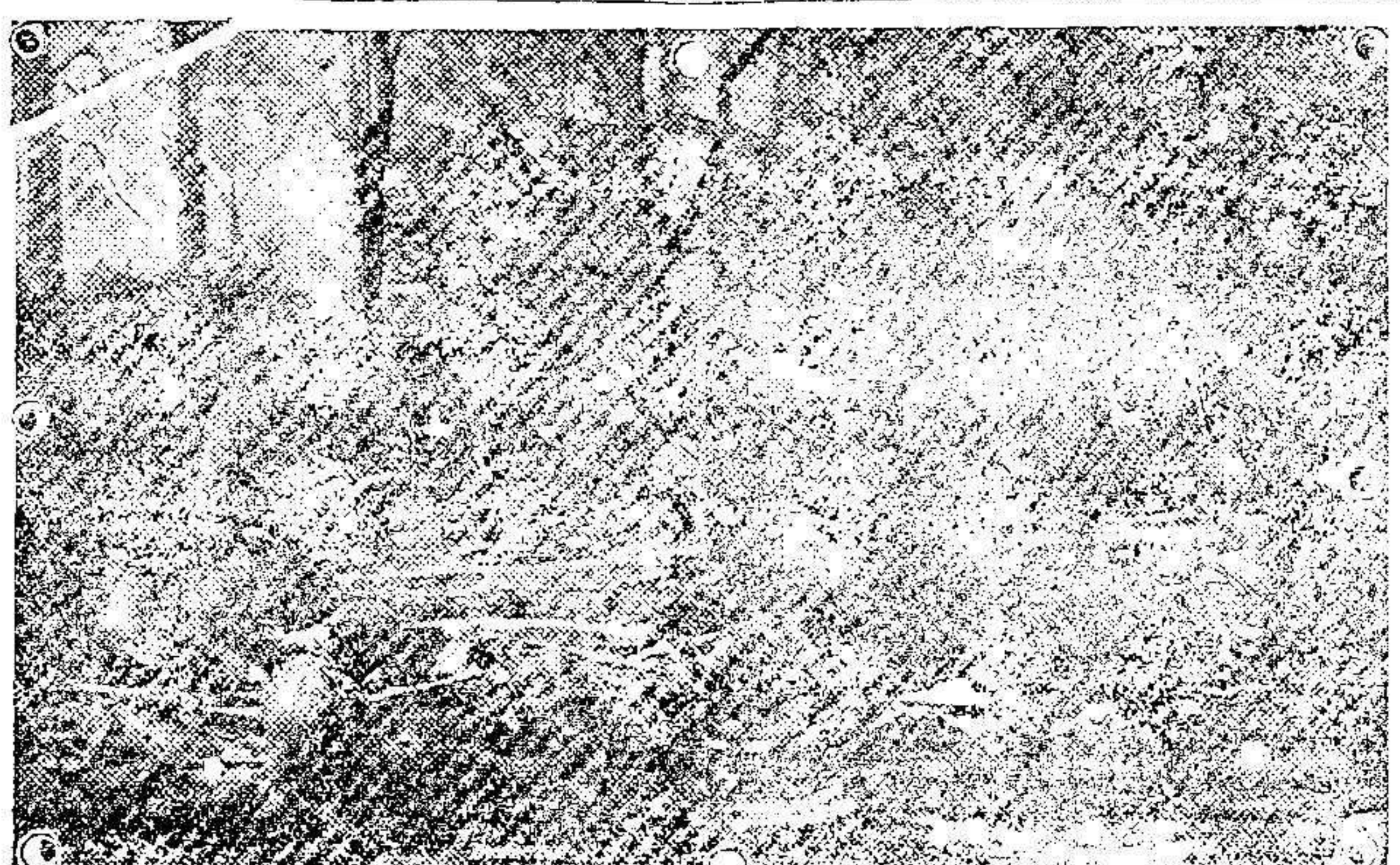
Combates en el San-Día de descanso.

Una mecha partida de Tarudán, bajo los órdenes del Muir, reforzará a esas fuerzas adictas.