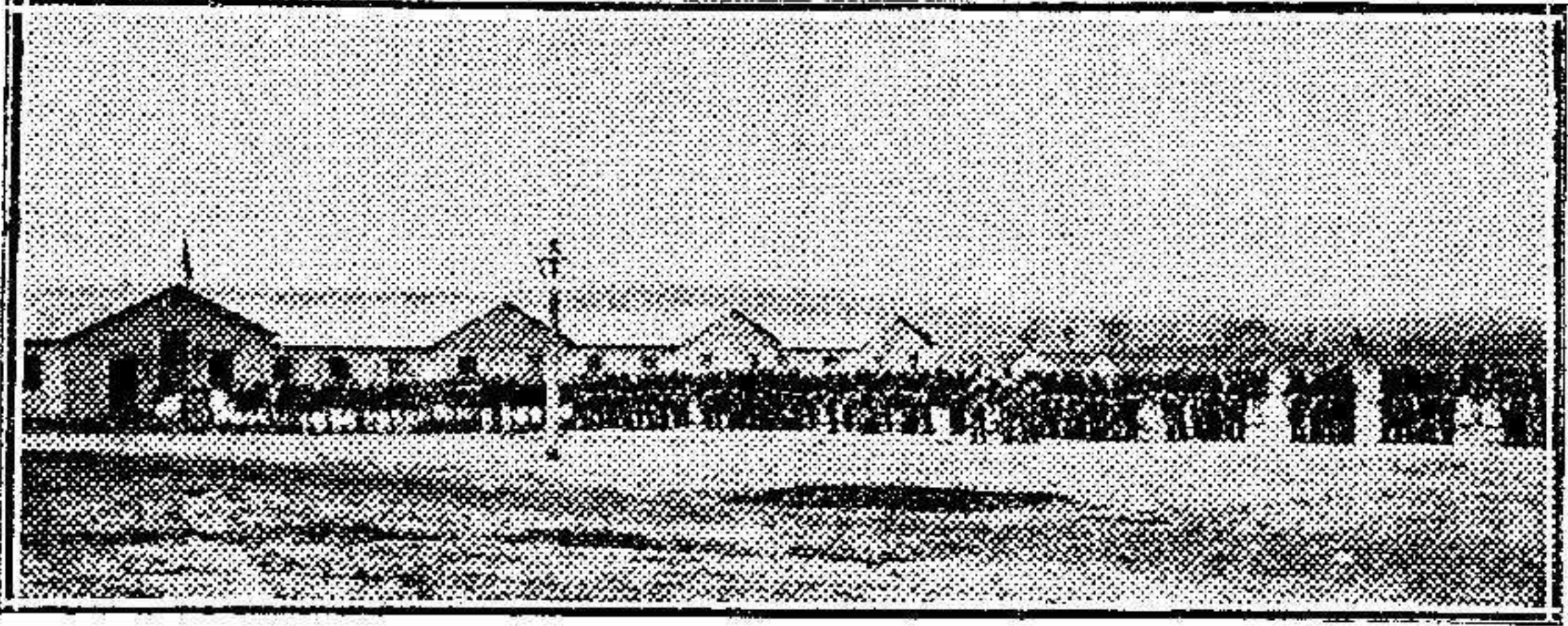
Alcazar.-Vista general del campamento.

Las comunicaciones con Alcazar-Kebir.-En el campamento general.-En Yuma el Tolba-ja 70 grados!