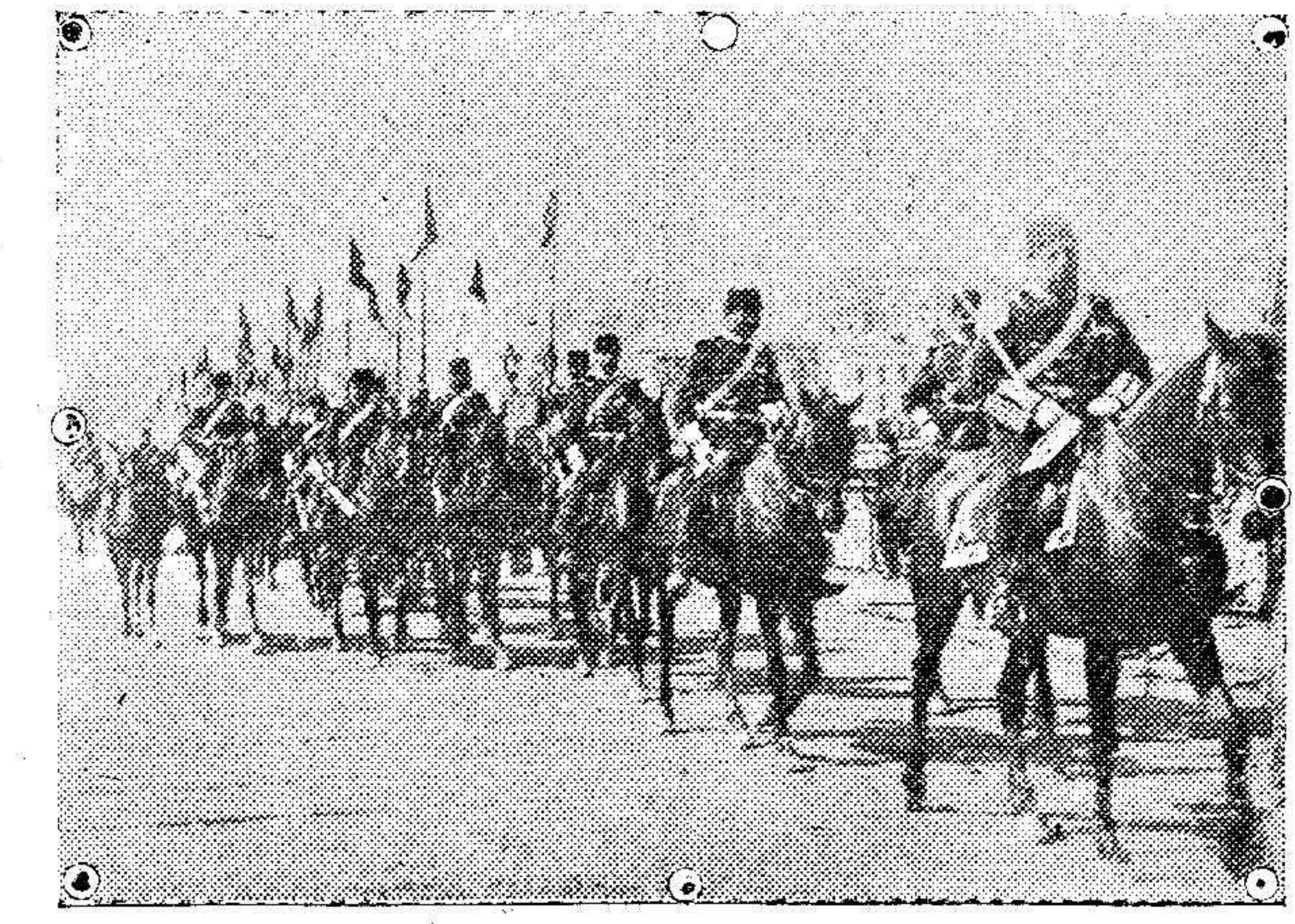
Caballería turca por las calles de Constantinopla