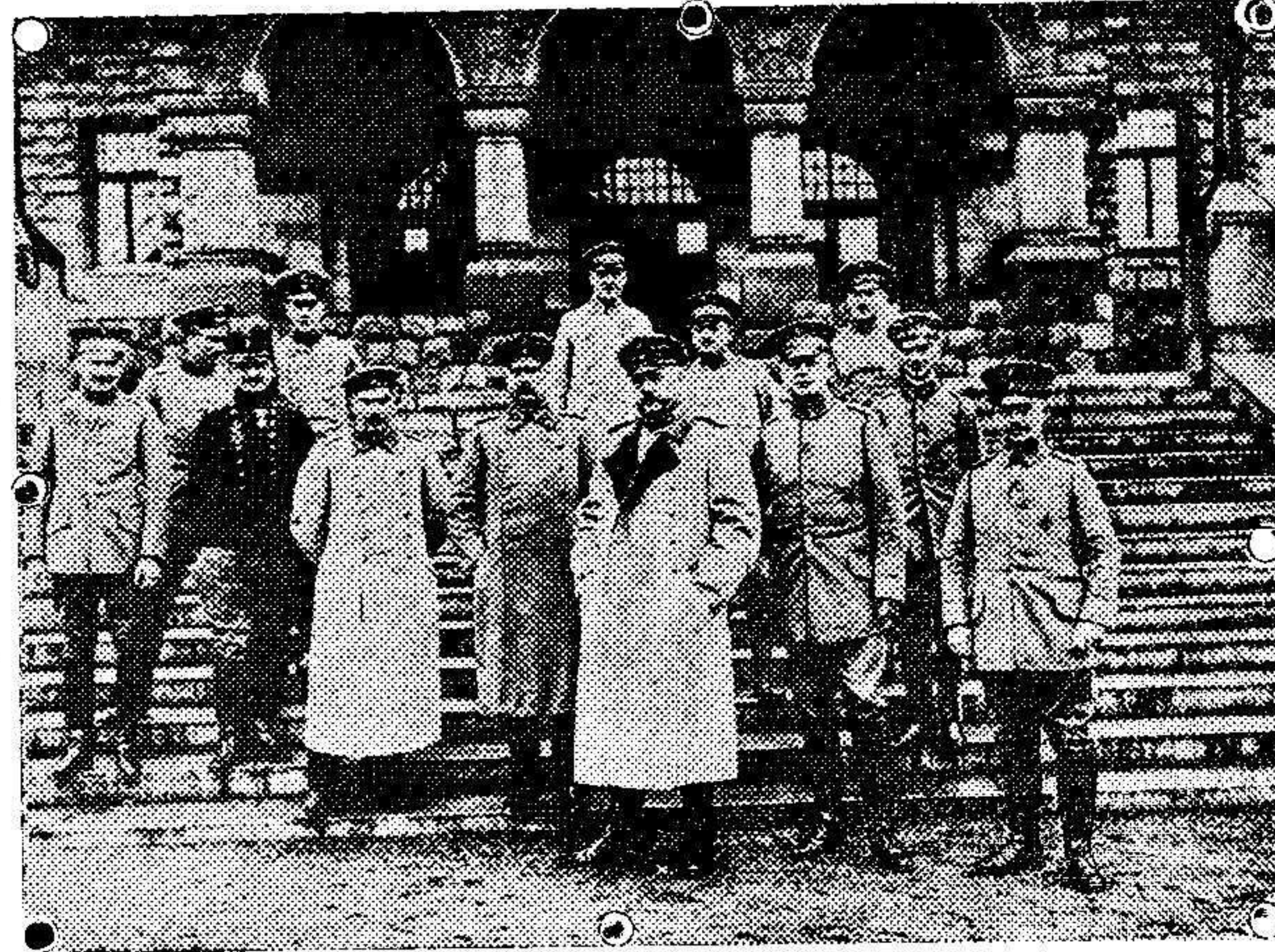
El General Hindenburg, que dirige la campaña contra los rusos, rodeado de su Estado Mayor.