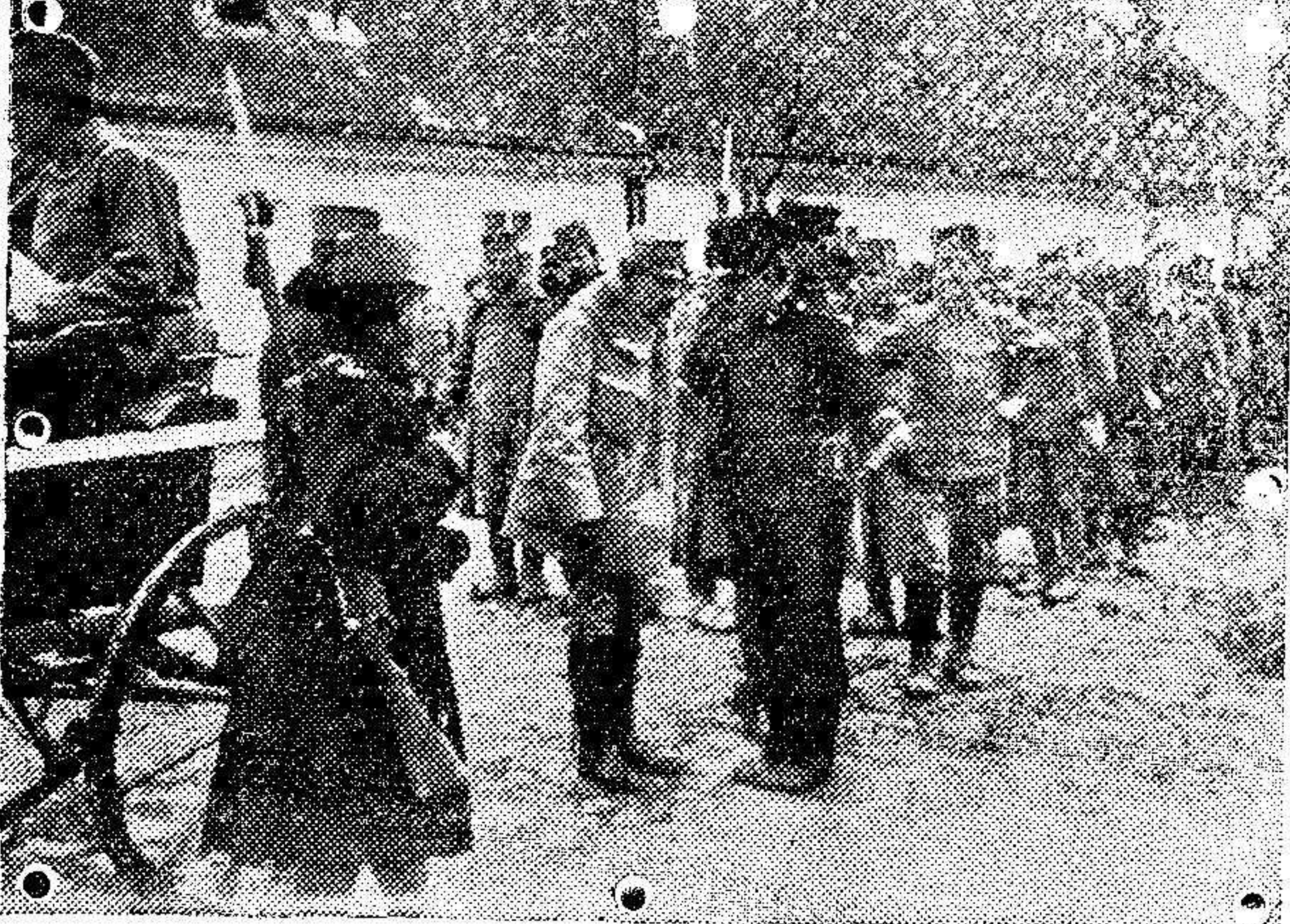
Prisioneros servios atravesando, bajo la custodia de sus aprehensores, una aldea austriaca