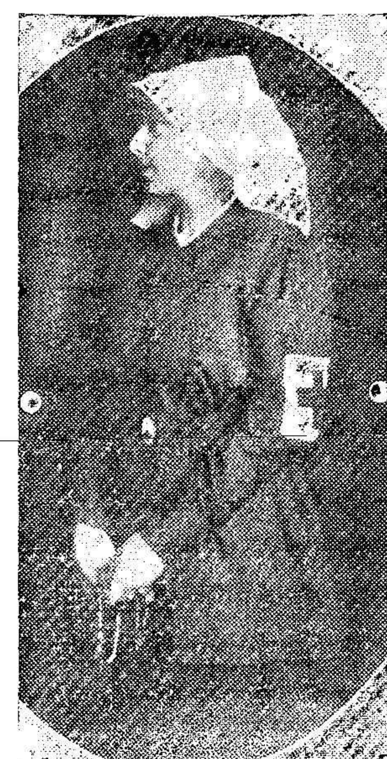
La condesa de Lonyay, hija del rey Leopoldo, que se ha puesto á disposición de la Cruz Roja de Austria para prestar socorro á los heridos.