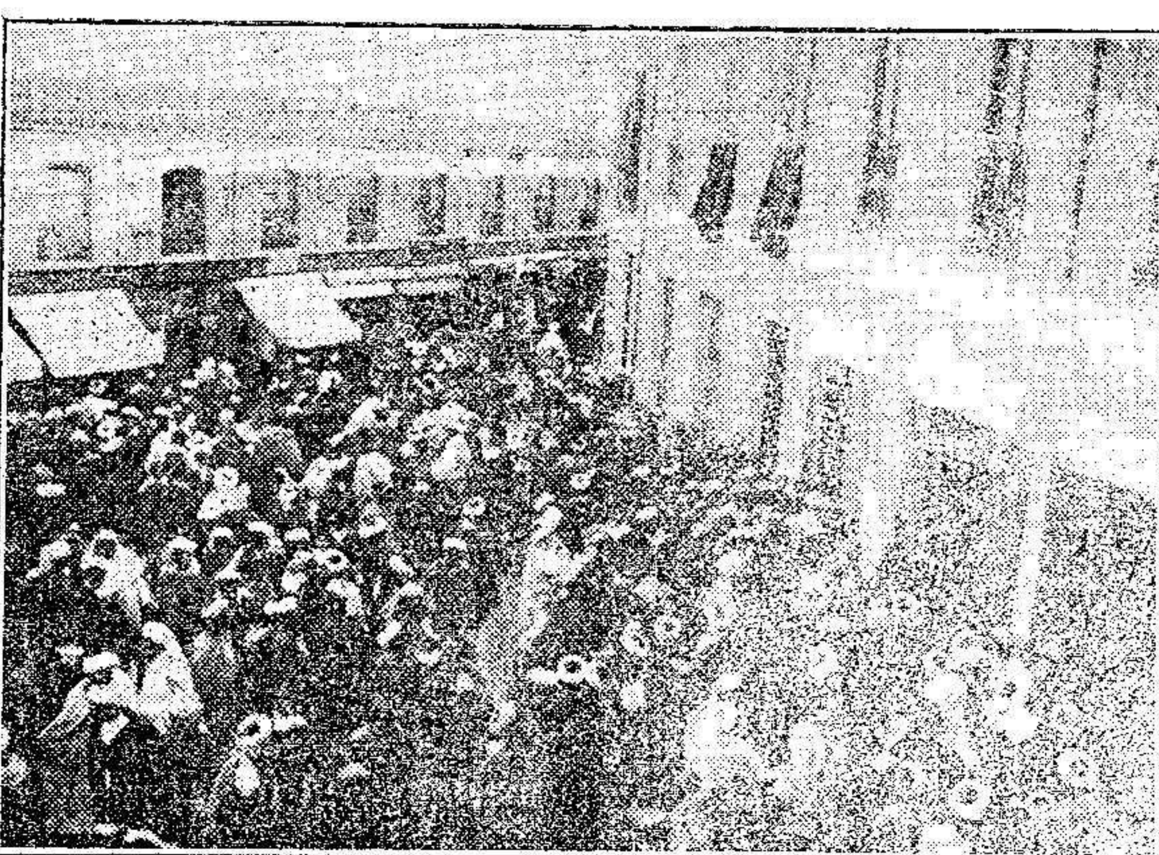
Los rifeños adquiriendo billetes en las casas consignatarias.

La mujer del desaparecido recibió después del viaje de su marido tres cartas, dos fechadas en Coruña y una en Orense.