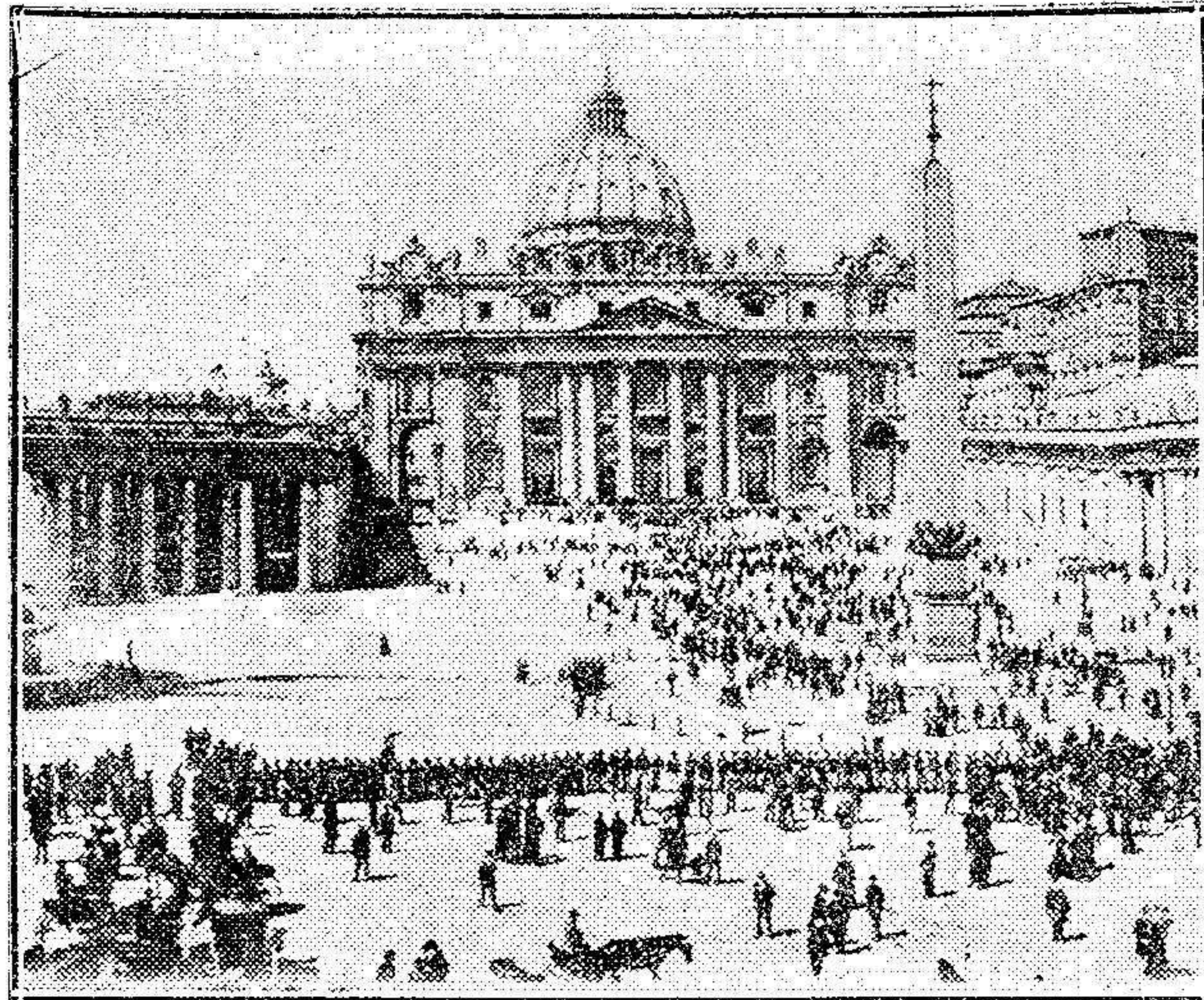
El público ante la Basílica de San Pedro esperando noticias de la enfermedad de Su Santidad Pío X.