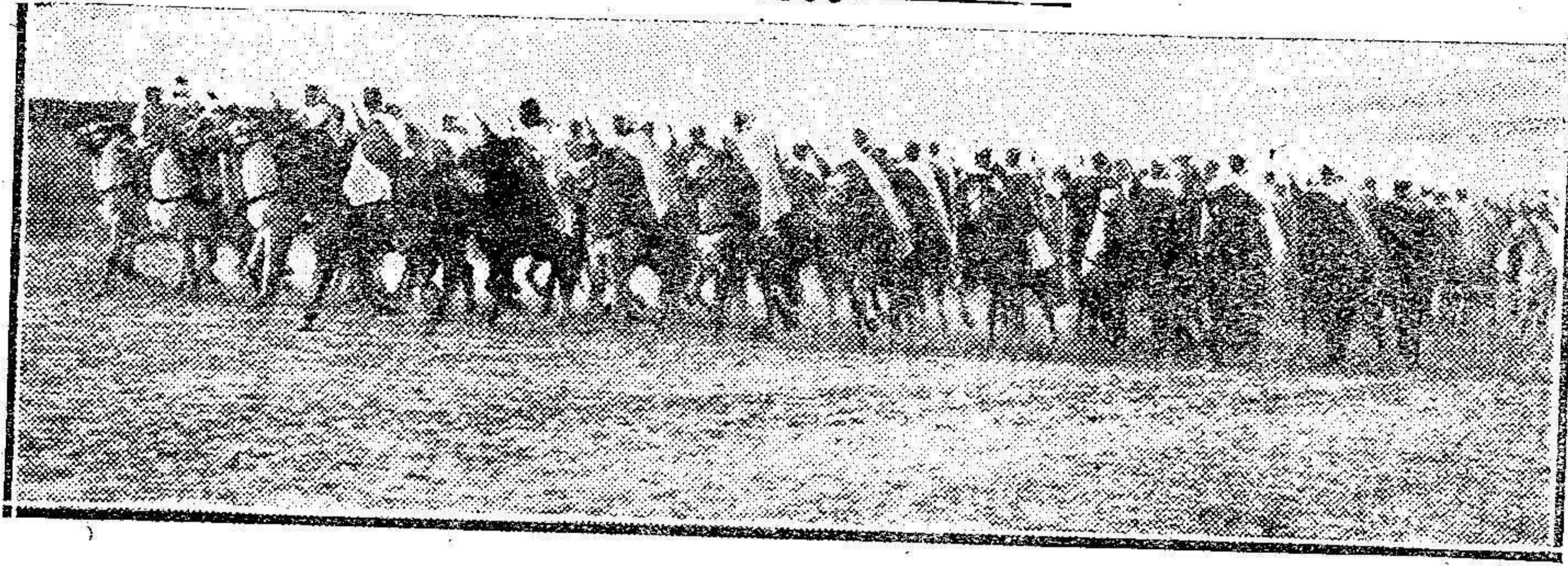
Escuadrones de las Fuerzas Regulares Indígenas.