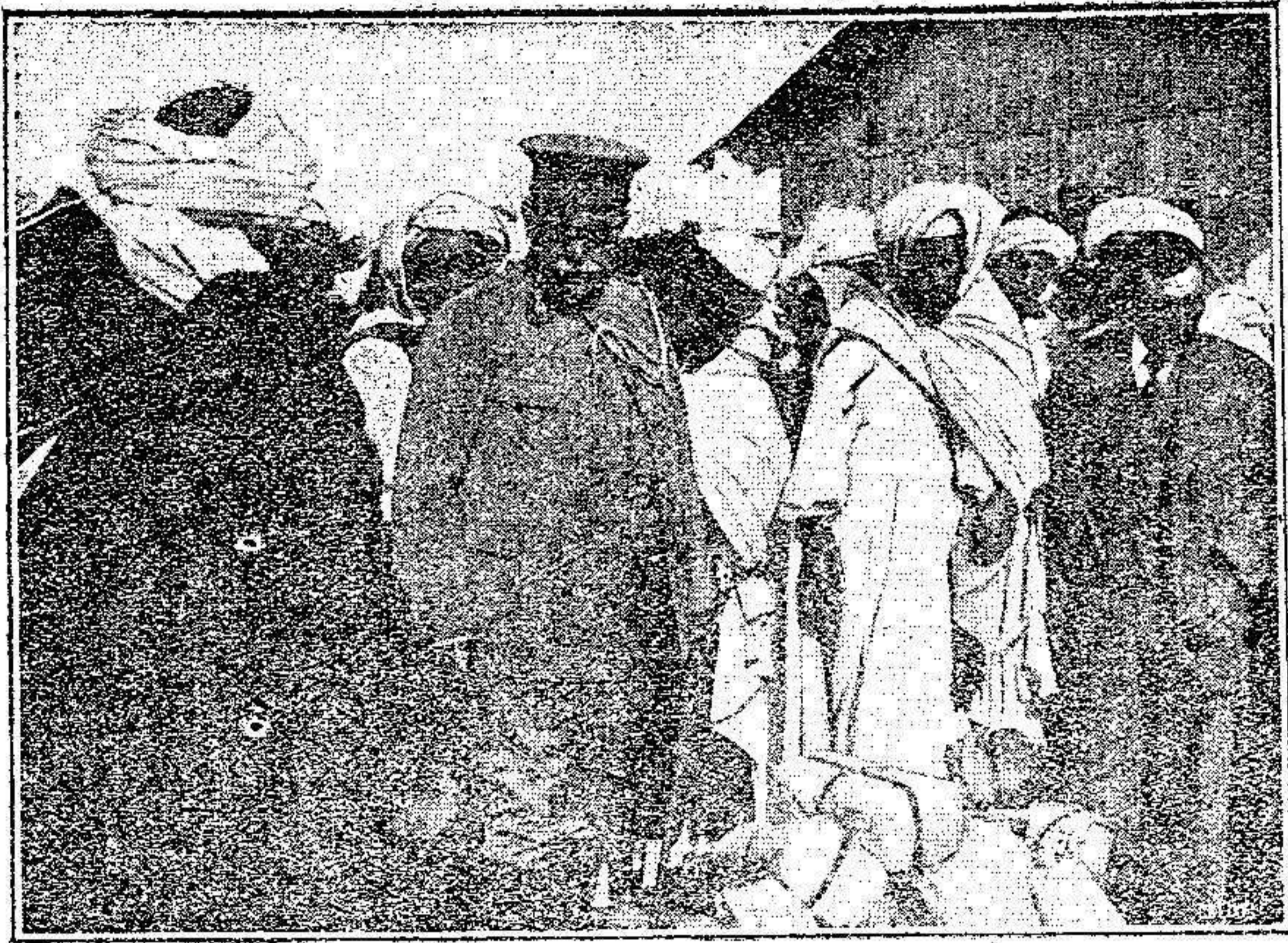
BENI-SICAR El General Jordana con los caídos, presenciando el reparto de abonos