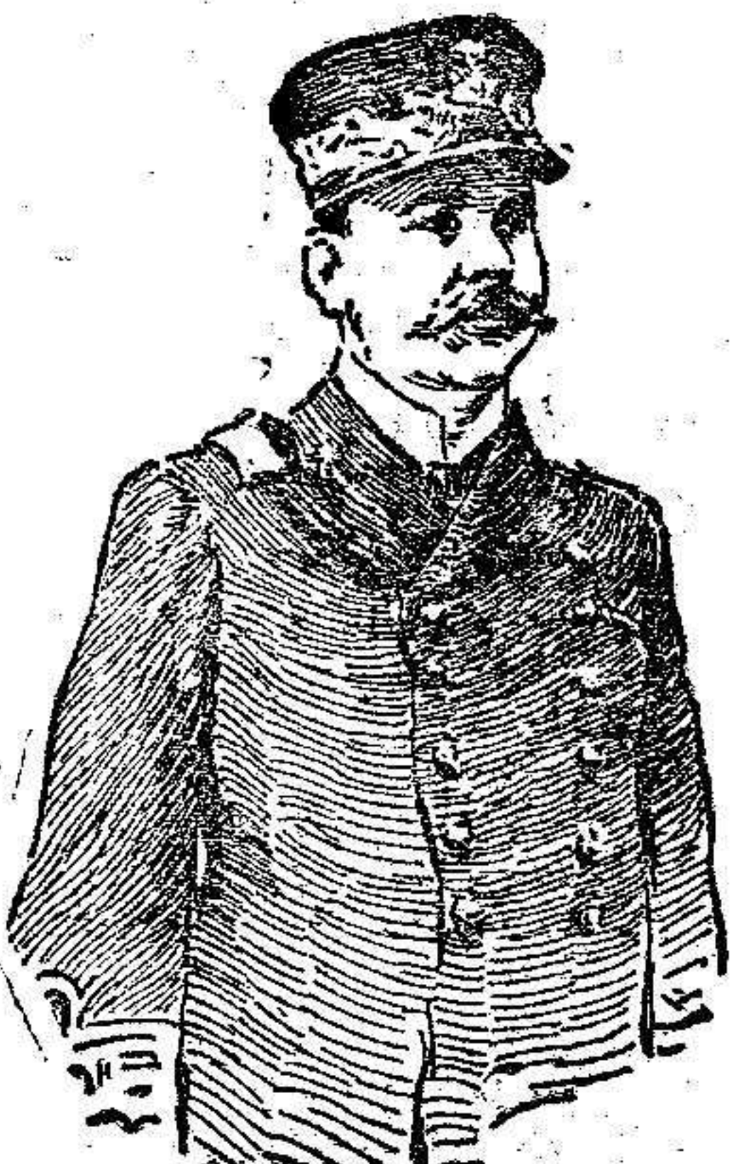
El contra-almirante Leonardi Cattolica, ministro de Marina de Italia

Como buen napolitano, el actual ministro de Italia, «signor» Leonardi Cattolica, nació marino, y al mar consagró su juventud y sus talentos. Ingresó en la Escuela de Marina en 1867, y en 1879 haciase á la mar por primera vez como guardia marina. Las ciencias astronómicas y náutica tuvieron en Cattolica desde sus tiempos de estudiante, un apasionado adorador, y, tales llegaron á ser sus conocimientos en una y otra, y tan grande su autoridad en ambas, que los astrónomos más eminentes del mundo señalan como uno de sus compañeros más eminentes; el Gobierno italiano le otorga una cátedra en la Academia de Marina de Nápoles y más tarde sucede al almirante Mirabito en la dirección del Instituto Hidrográfico.