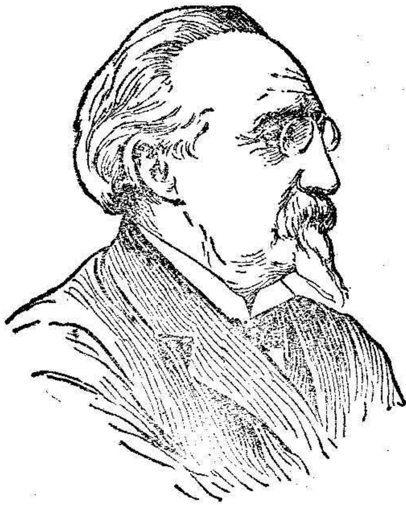
D. Manuel Arriaga Presidente de la República portuguesa

Las regatas que anualmente se celebran en Bilbao, han revestido este año extraordinaria brillantez por haber tomado parte en ellas nuestro jóven Soberano.