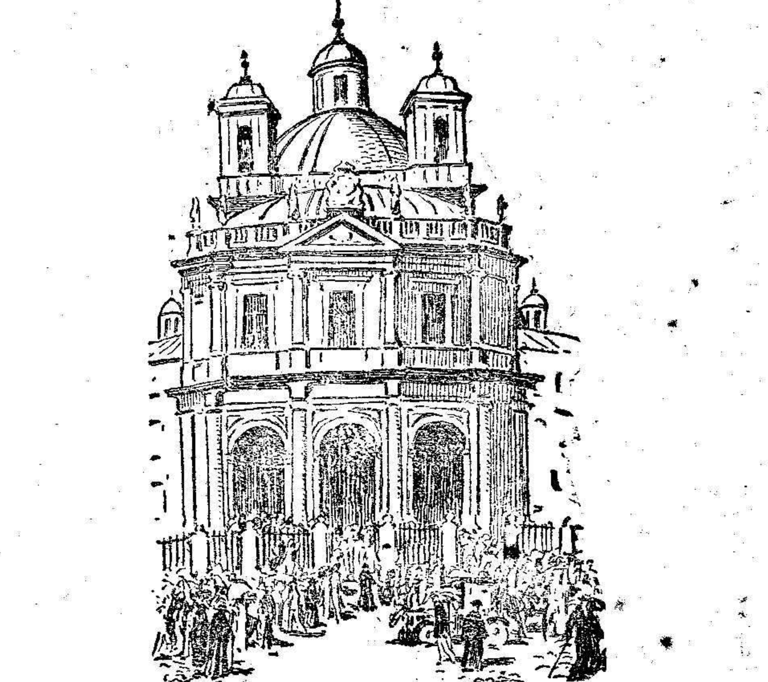
Entrada de los Congresistas en la Iglesia de San Francisco el Grande, para asistir á la sesión de clausura del Congreso Eucarístico.