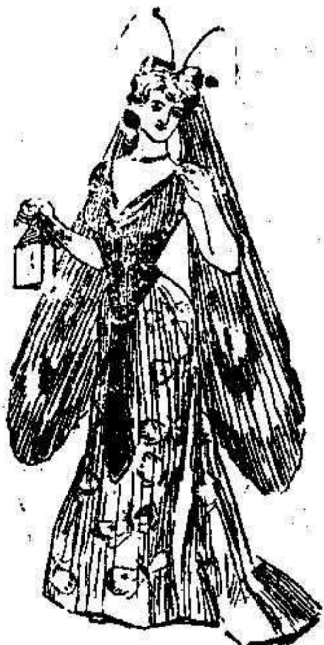
El alba.—Este raro disfraz combinase con tonos blancos y negros. Descote largo; corsé con estrellas; del cinturón de terciopelo pende una extensa cinta de lo mismo y del tocado largas gasas en forma de alas. Adornase la falda con mariposas de raso bordadas con hilo de oro.