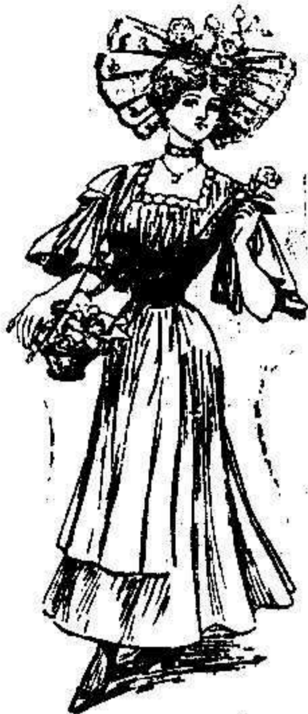
Caprichoso disfraz.—Peto de terciopelo verde obscuro. Camisolin de seda blanca con amplias mangas formando muchos pliegues. Descote cuadrado formado por puntilla de oro. Falda blanca.