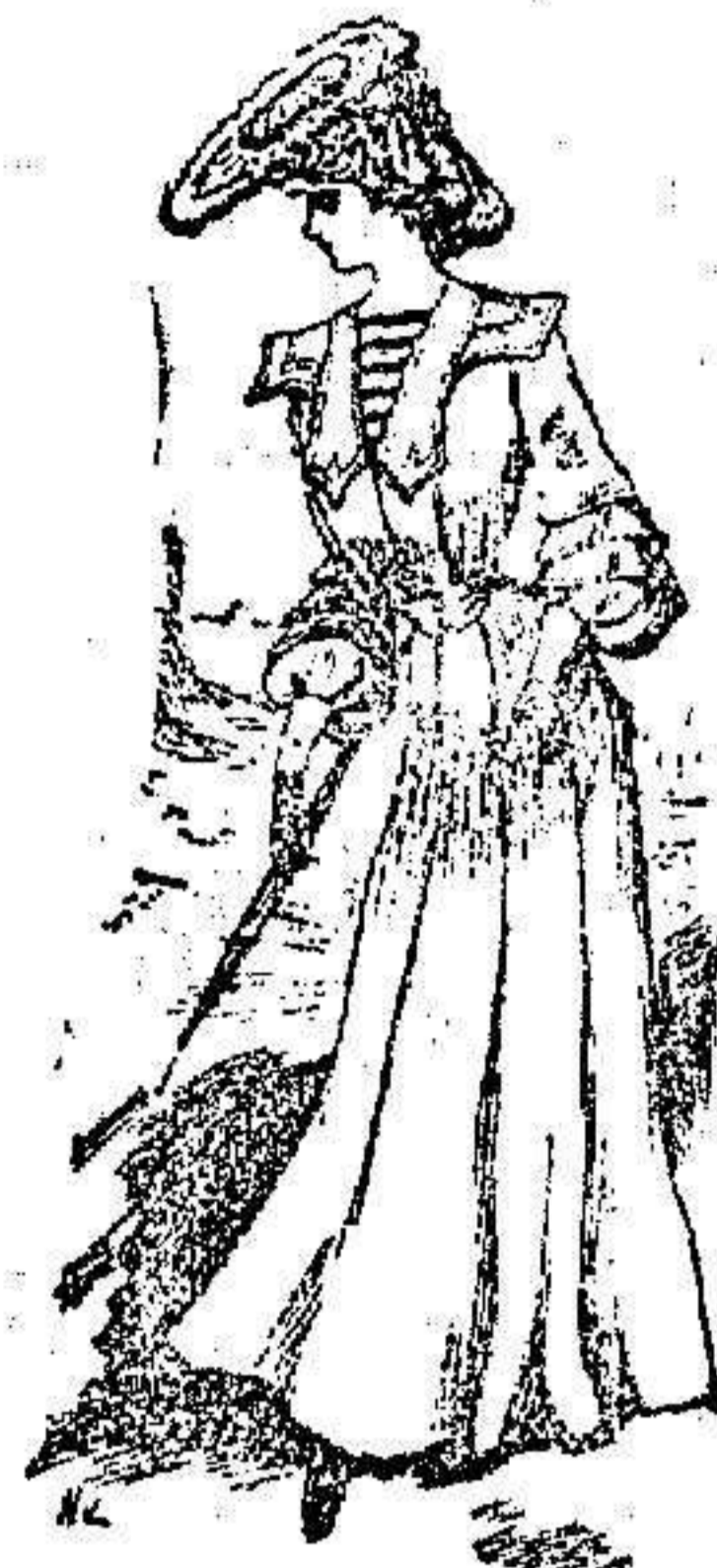
Vestido para niña de 8 á 12 años

De tela, color claro. Cuello-campana con varios órdenes de puntilla, y de parecidos dibujos á él los del delantero. Manga-fanal con amplia puntilla en su terminacion. Falda lisa con iguales adornos que el cuerpo.