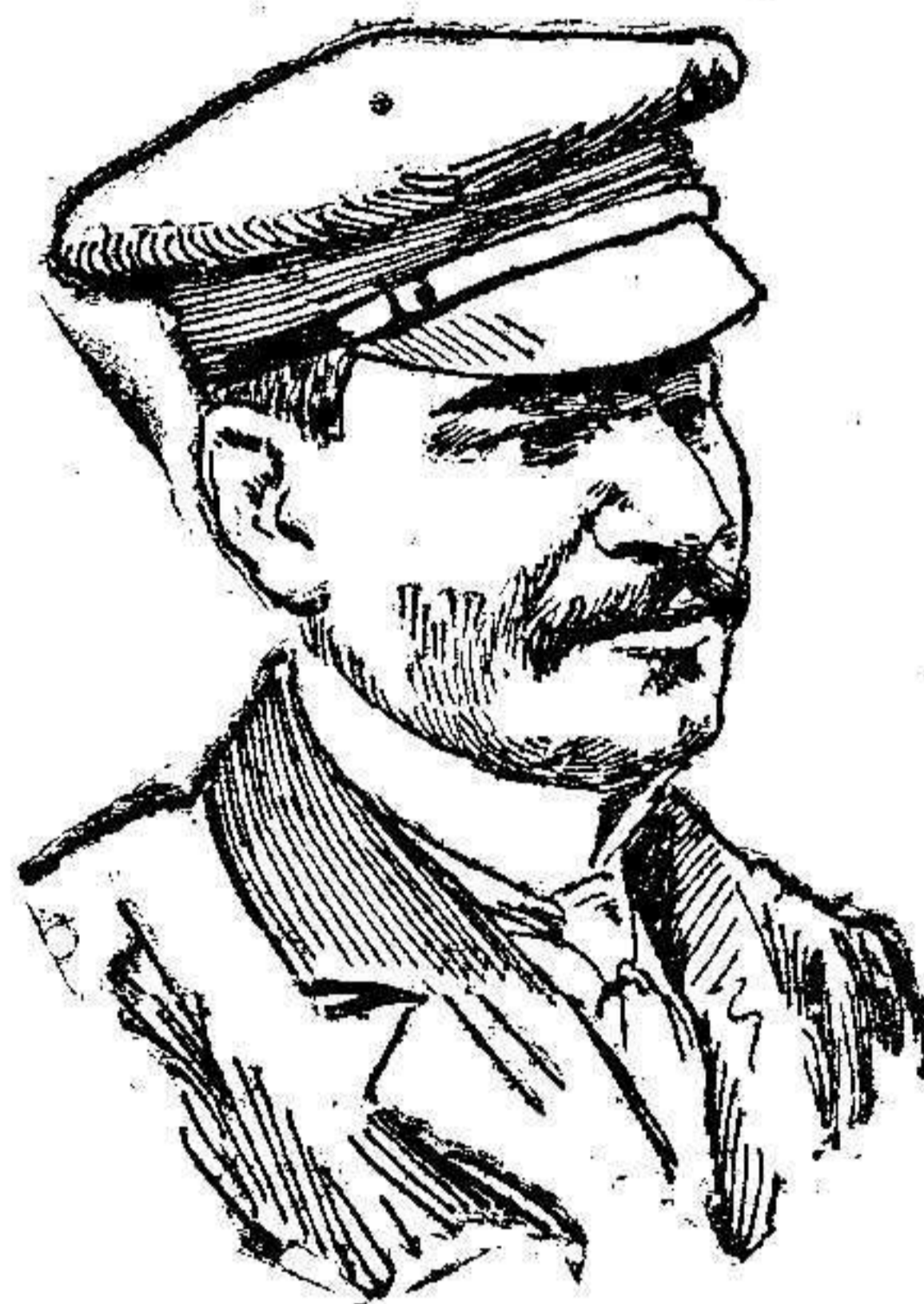
El general Hermes de Fonseca, nuevo presidente del Brasil.

Muy en breve, el mariscal Hermes de Fonseca tomará posesión de la presidencia de la República brasileña, para la que ha sido elegido por doscientos setenta y tres mil votos.