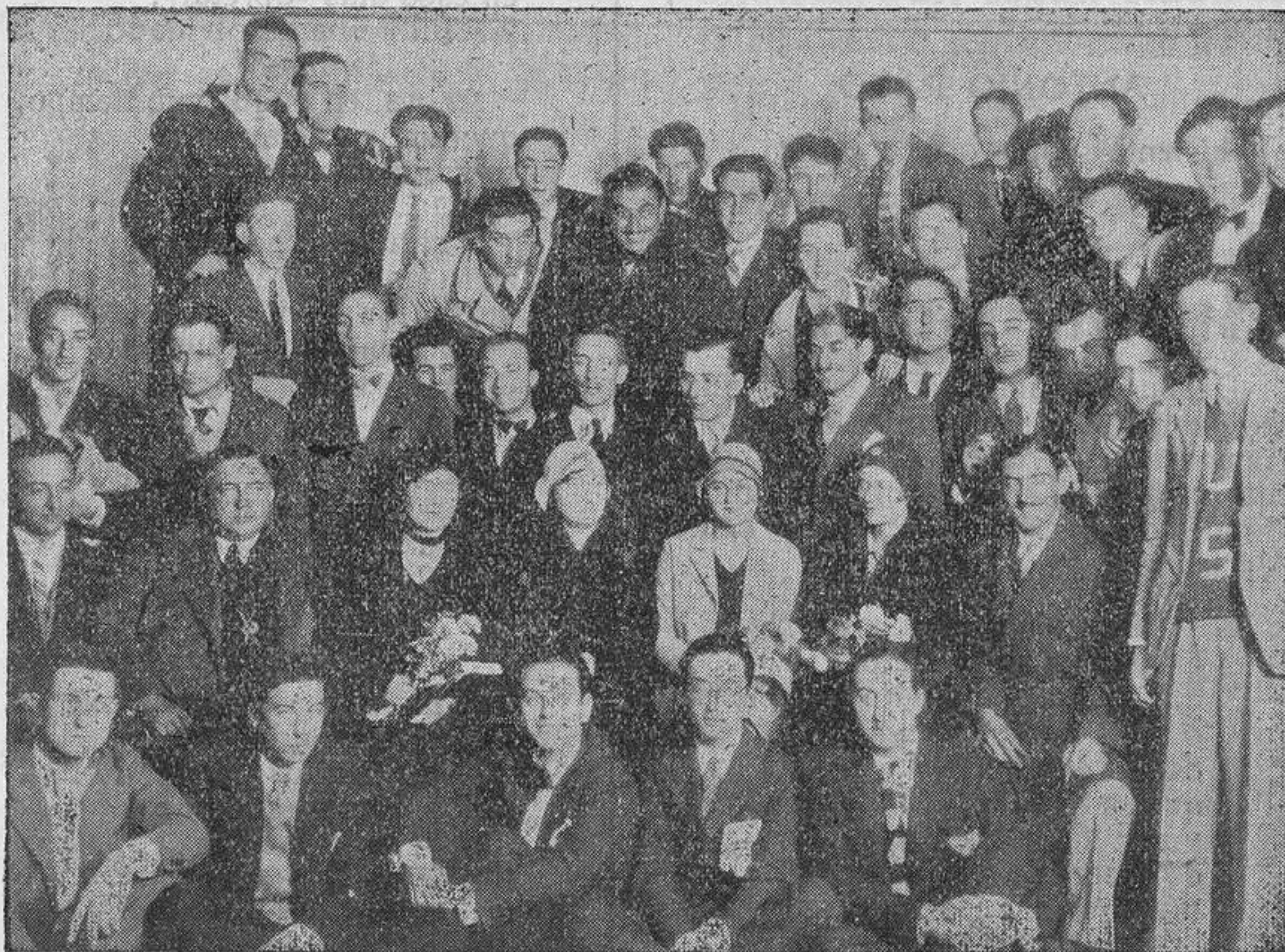
Los estudiantes argentinos en el local de la F. U. E. con algunos estudiantes de la misma.

Sanz les obsequió como recuerdo con unas cuantas ampliaciones del patio de las Dueñas, ya que no les han construído a las monjitas una casa barata dedicada al santo arte de la clausura, para que, libres de esa traba, pudiera todo el mundo admirar las bellezas que ese patio encierra. Amigo Julián: ¡no te convienen las visitas!