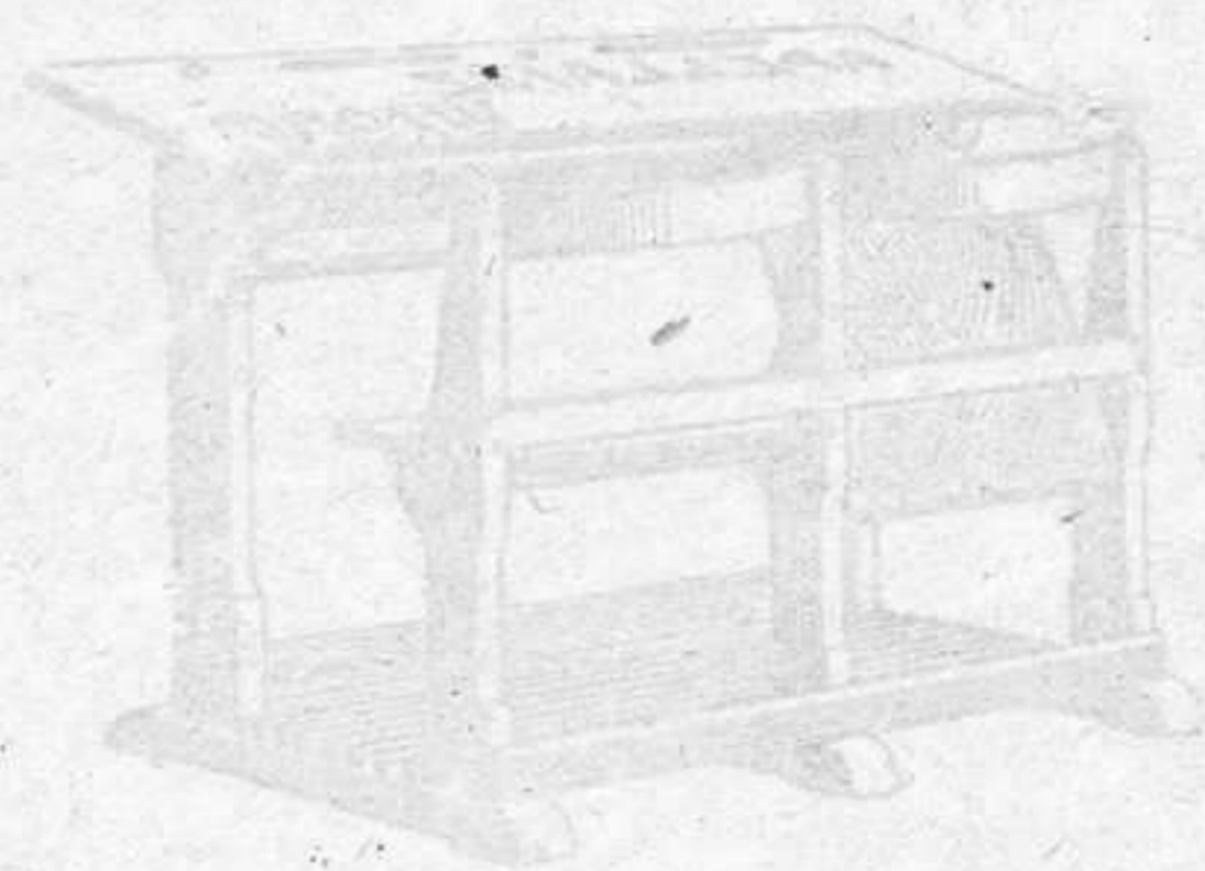
Modelo oficial del Ministerio de Instrucción

Se fabrican con madera de haya, en tamaño para 7, 9, 11 y 13 años. Solo citan precio por indicación de tamaño y se costeará franco de porte.