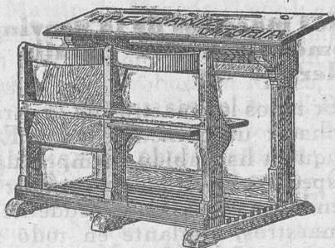
Modelo oficial del Museo pedagógico Nacional

MESA-BANCO BIPERSONAL, DE ASIEN- TOS GIRATORIOS Y REJILLA FIJA