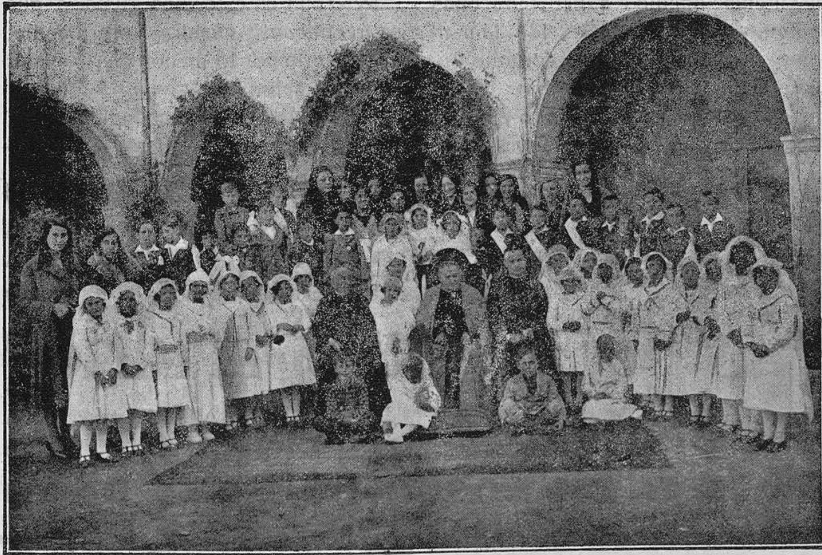
Niños vestidos por el «Ropero de Santa Teresa de Jesús», el día de su Primera Comunión, año de 1932, retratados después de desayunarse, presididos por el Excmo. señor Obispo, en el Patio de las MM. Teresianas.

Desde esta fecha, hasta el 1.º de enero de 1931, se confeccionaron 720 piezas de vestir, que se distribuyeron entre 137 familias.