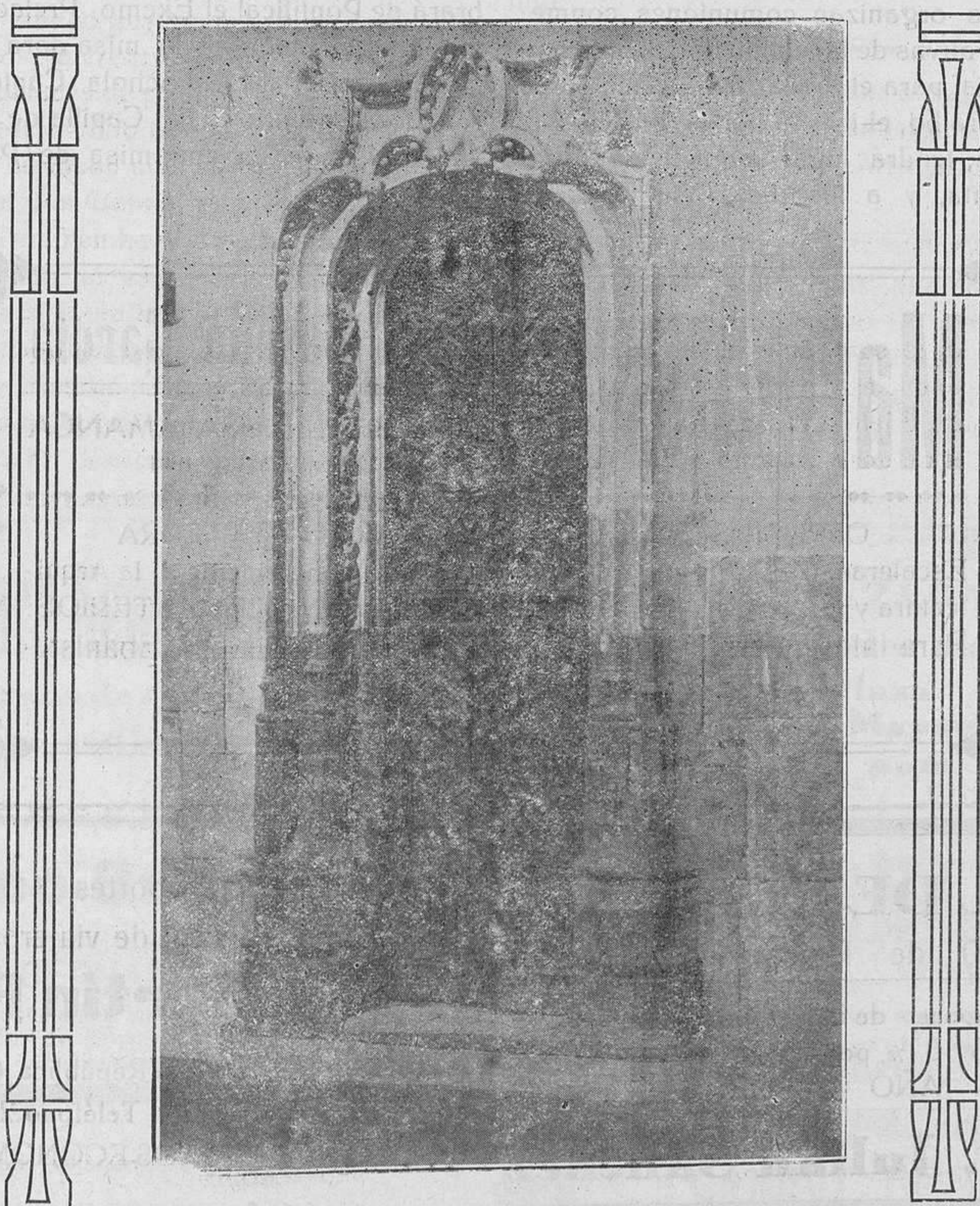
Ciudad Rodrigo.—Catedral, Puerta lateral del Coro

A las imprudentes correrías del portugués antes de este sitio se refieren sin duda las actas municipales, cuando a 26 de Agosto de 1474 dicen: «Por