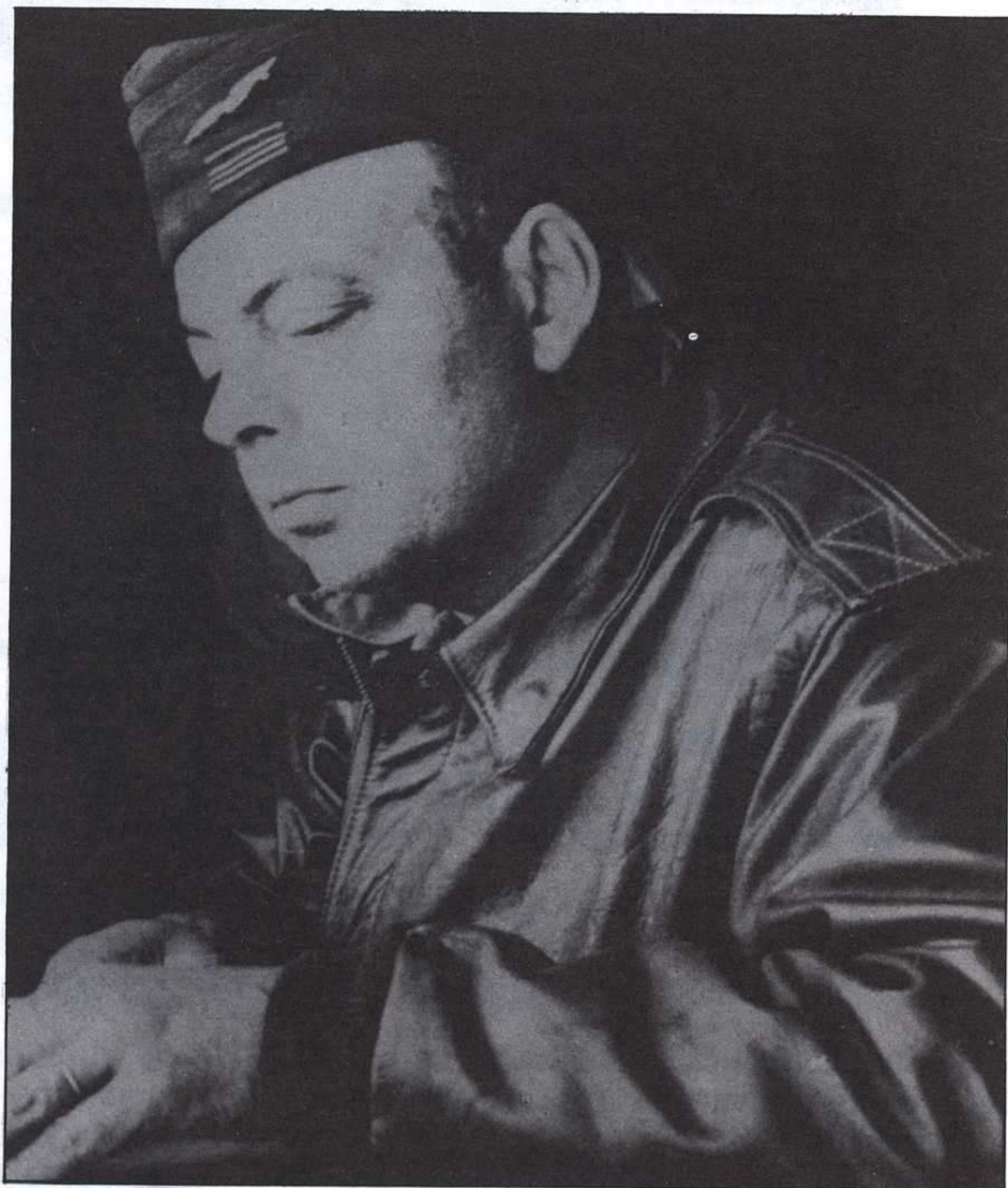
ANTOINE DE SAINT-EXUPÉRY.

piloto comercial y piloto de guerra, que terminaron el 31 de julio de 1944, cuando él y su avión desaparecieron para siempre, cuando realizaba una misión de reconocimiento sobre la isla de Cerdeña.