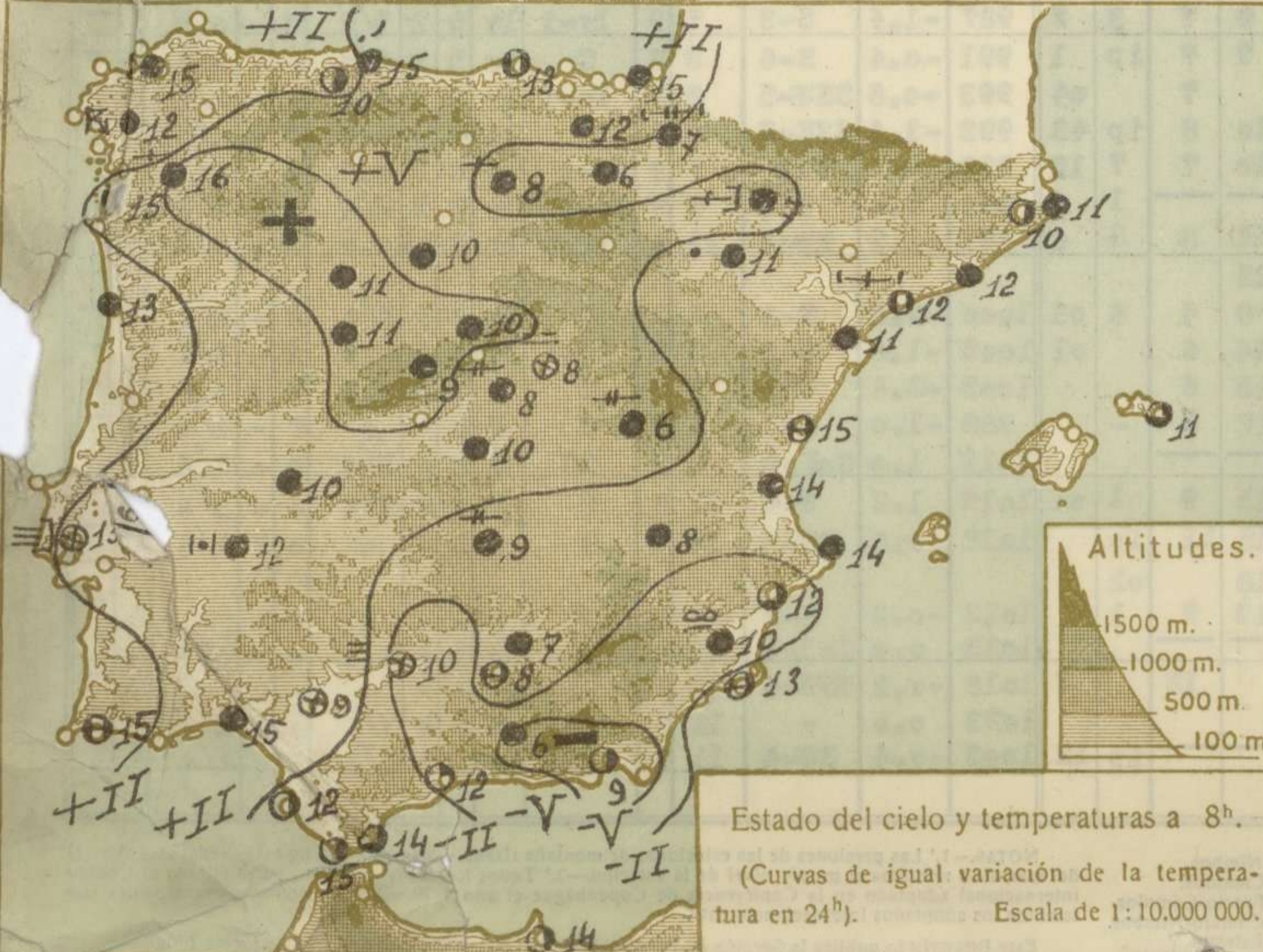
Estado del cielo y temperaturas a 8 h . (Curvas de igual variación de la temperatura en 24 h ). Escala de 1: 10.000.000.