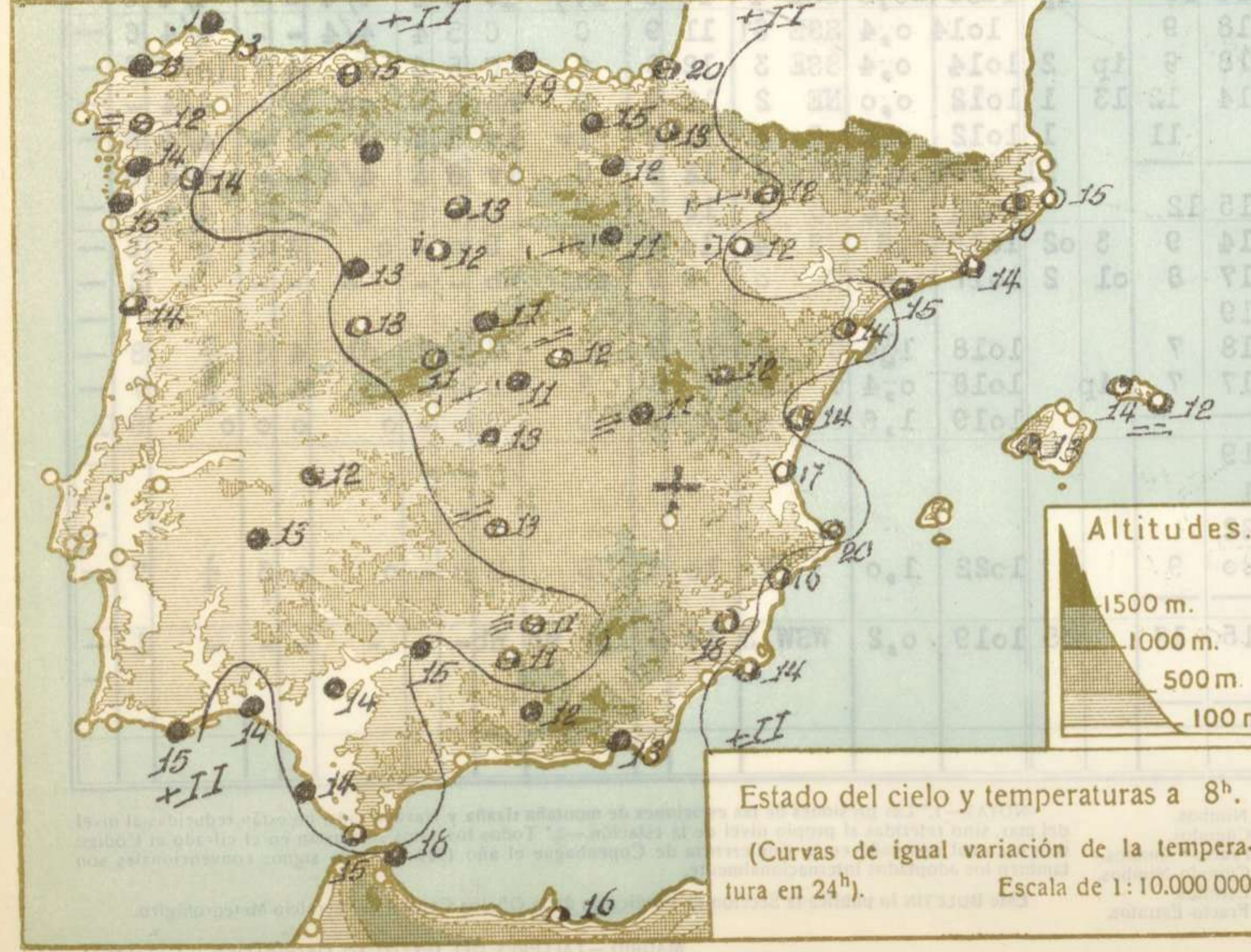
Estado del cielo y temperaturas a 8 h . (Curvas de igual variación de la temperatura en 2 h ). Escala de 1:10.000.000.