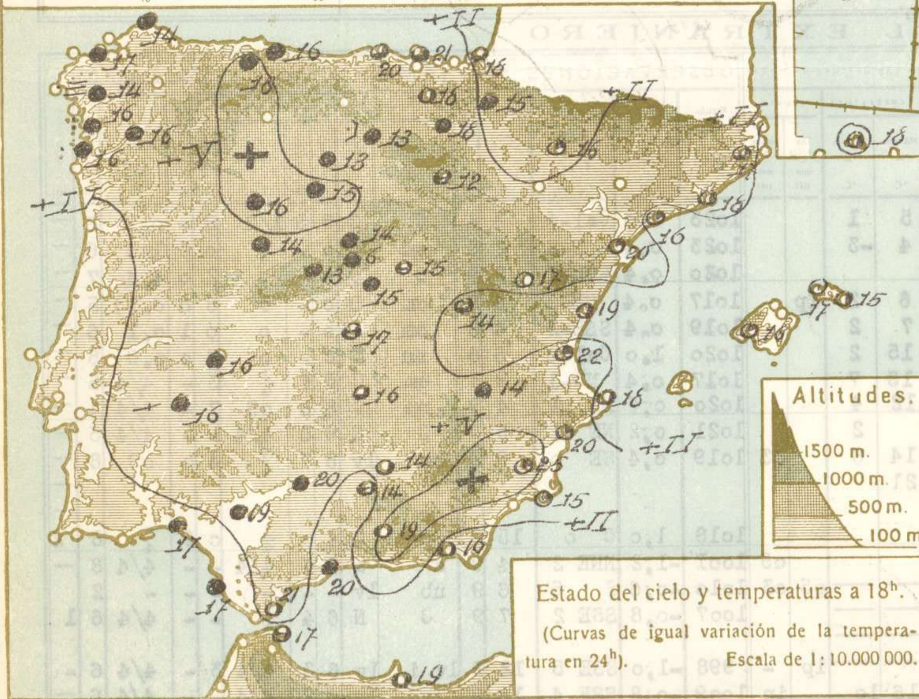
Estado del cielo y temperaturas a 18 h . (Curvas de igual variación de la temperatura en 2 h ). Escala de 1:10.000.000.