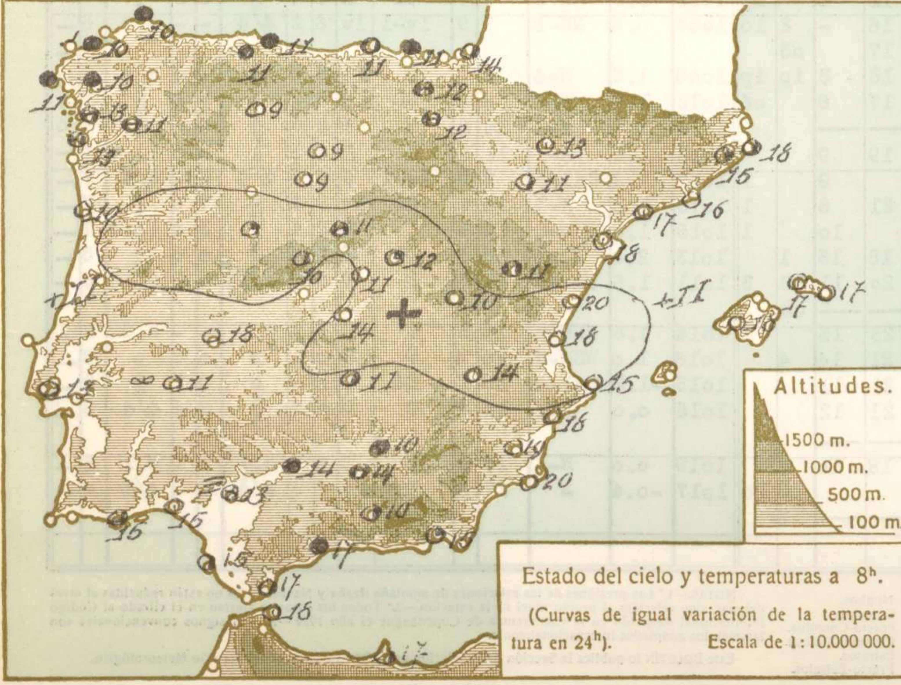
Estado del cielo y temperaturas a 8 h . (Curvas de igual variación de la temperatura en 24 h ). Escala de 1:10.000.000.