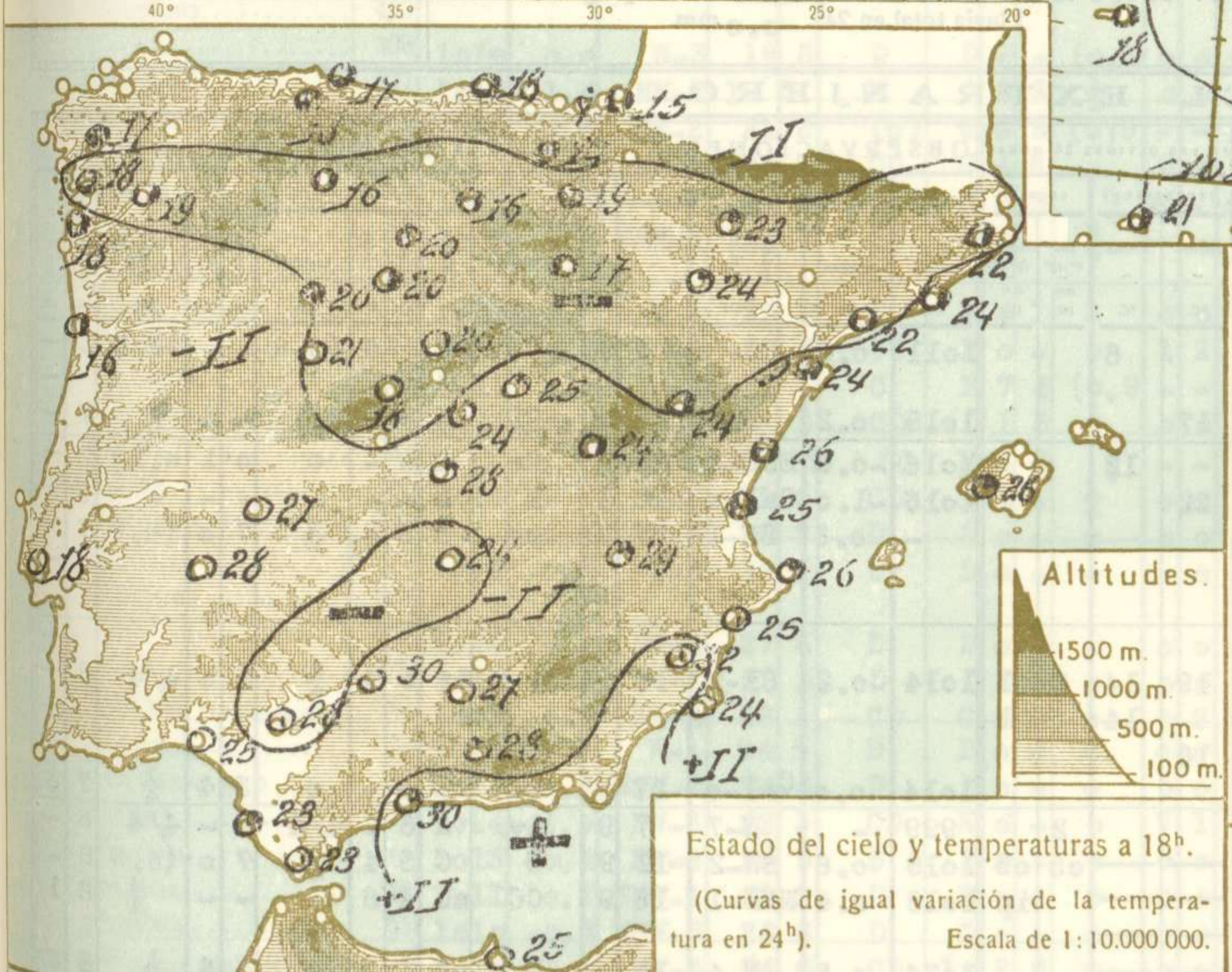
Estado del cielo y temperaturas a 18 h . (Curvas de igual variación de la temperatura en 24 h ). Escala de 1:10.000.000.