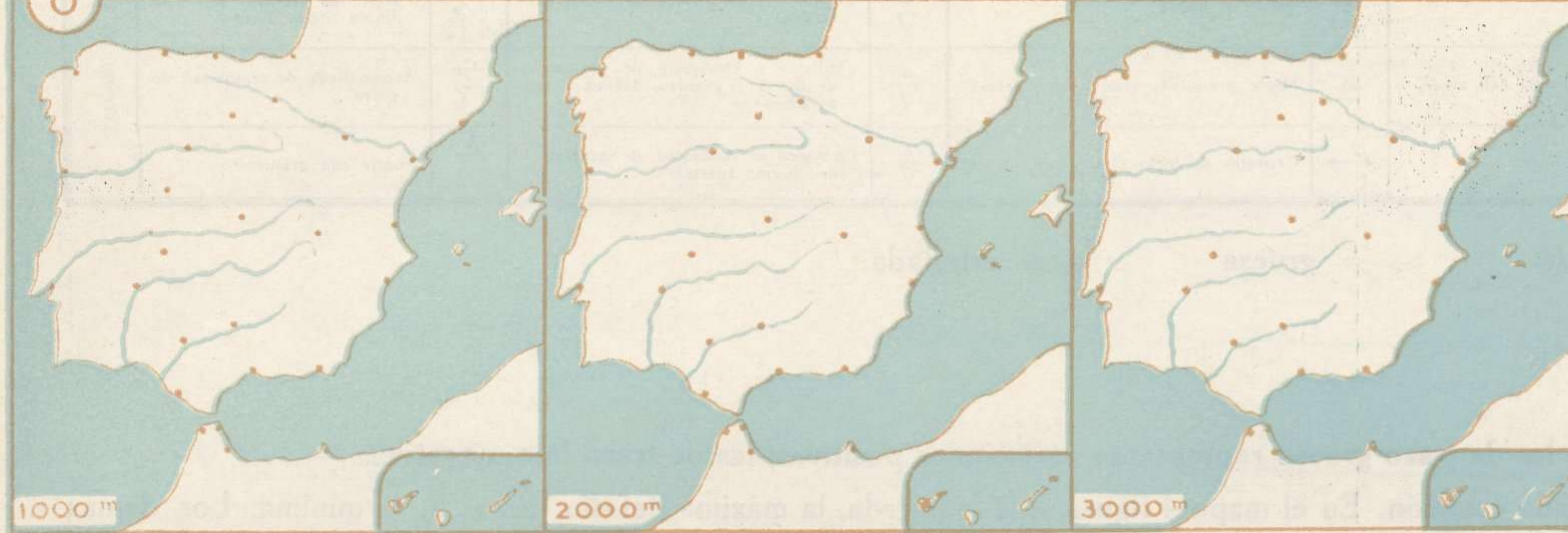
VIENTO EN LA ALTURA A 8" DE HOY