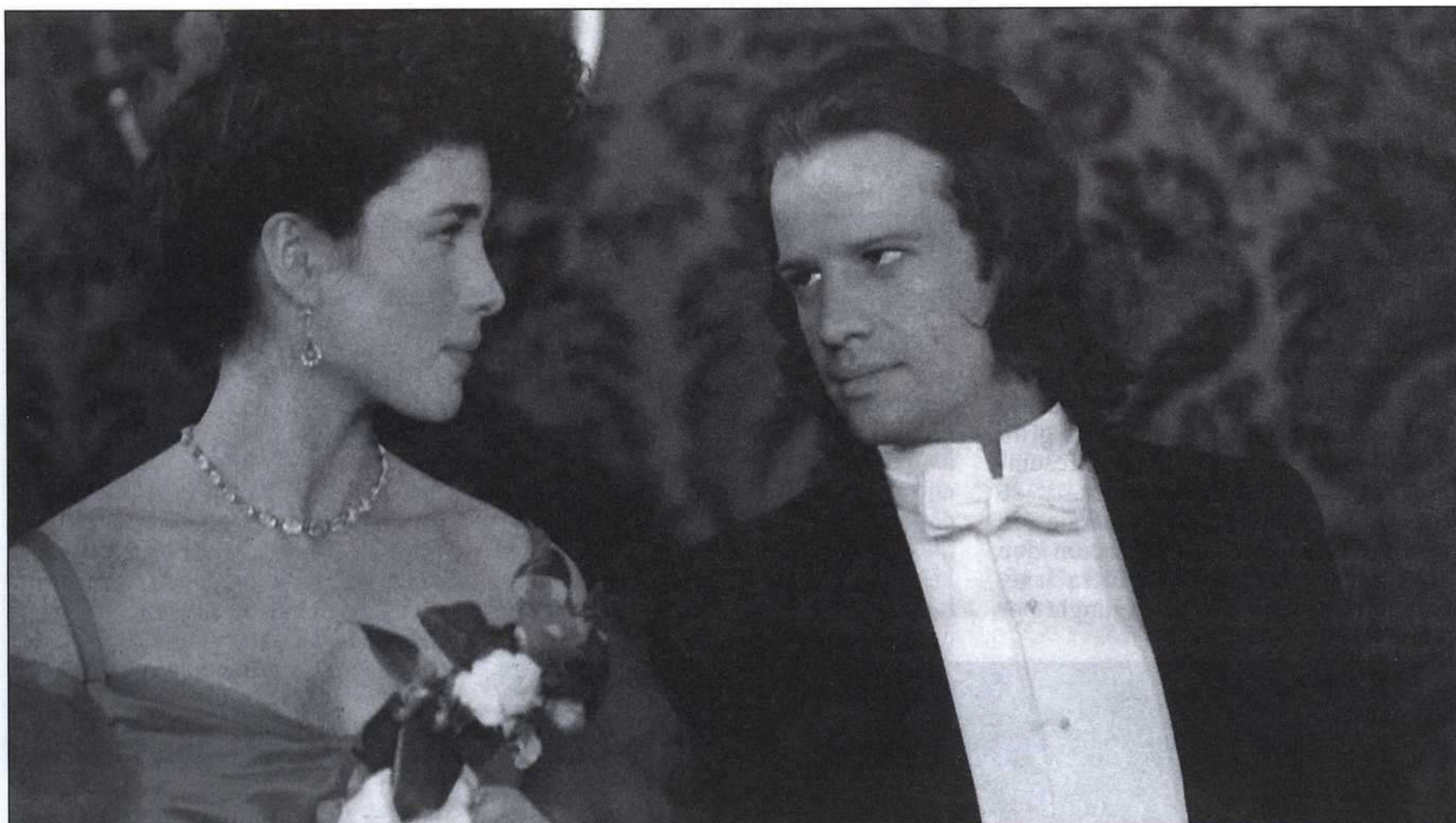
El filme de Hudson pone el acento en la llegada de Tarzan a Inglaterra y en sus problemas de adaptación a la civilización.

rey de los monos, de 1984, pretende ser fiel al contenido de la primera de las novelas de Burroughs, al relatar desde sus comienzos la vida del hombre-mono, sus primeros años en las selva y su ingreso en el mundo de la aristocracia británica, desde un punto de vista inédito en el cine. Ciertamente, Greystoke , utilizando la más avanzada técnica cinematográfica, escenifica un relato más o menos creíble, partiendo de espectaculares escenarios selváticos donde se desarrolla física y sentimentalmente la infancia y la juventud del héroe. El acento, sin embargo, se carga sobre la posterior etapa de su vida, en su llegada a Inglaterra y en las dificultades de todo tipo que se opusieron a su adaptación a las costumbres civilizadas, en la lucha vital de Tarzan contra Greystoke, dos personalidades contrapuestas que concurren en el mismo ser, sin que ninguna de ellas prevalezca sobre la otra, y que finalmente logran conciliarse y convivir pacíficamente en el espíritu de un héroe que, así humanizado, llega a serlo mucho más. Christopher Lambert fue quien encarnó en esta ocasión al mítico rey de la selva. ■