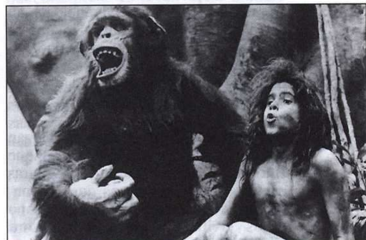
Tarzan será amamantado por una simia, y se convertirá en el rey de la selva.

No puede dudarse pues que los genes aristocráticos de Lord Greystoke anidaban en el cuerpo de Tarzan que,