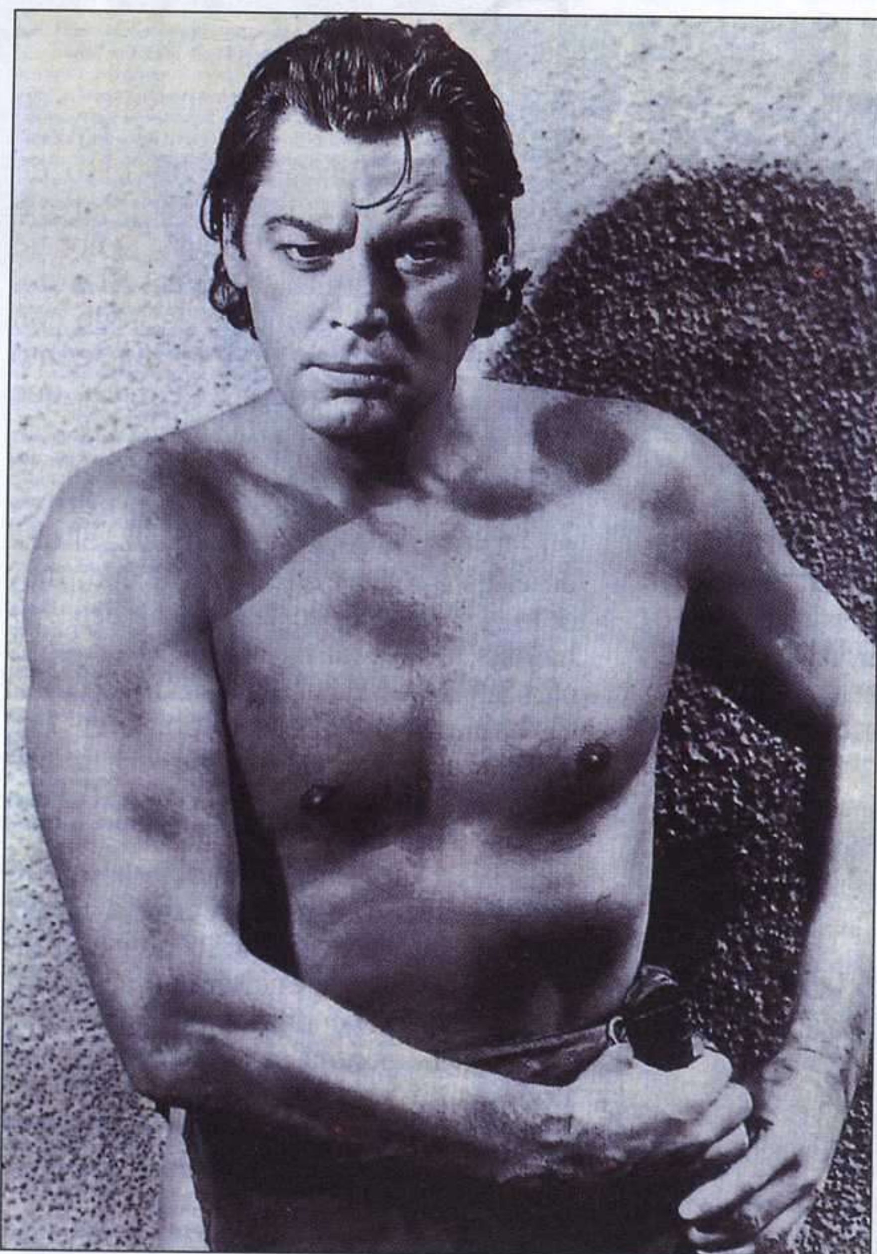
El nadador Johnny Weissmuller ha quedado en la conciencia popular como la verdadera imagen de Tarzan.

La primera de ellas, interpretada por Elmo Lincoln vestido con amplios ropajes de piel atigrada, fue estrenada en 1918 y trataba de seguir las huellas de su creador literario,