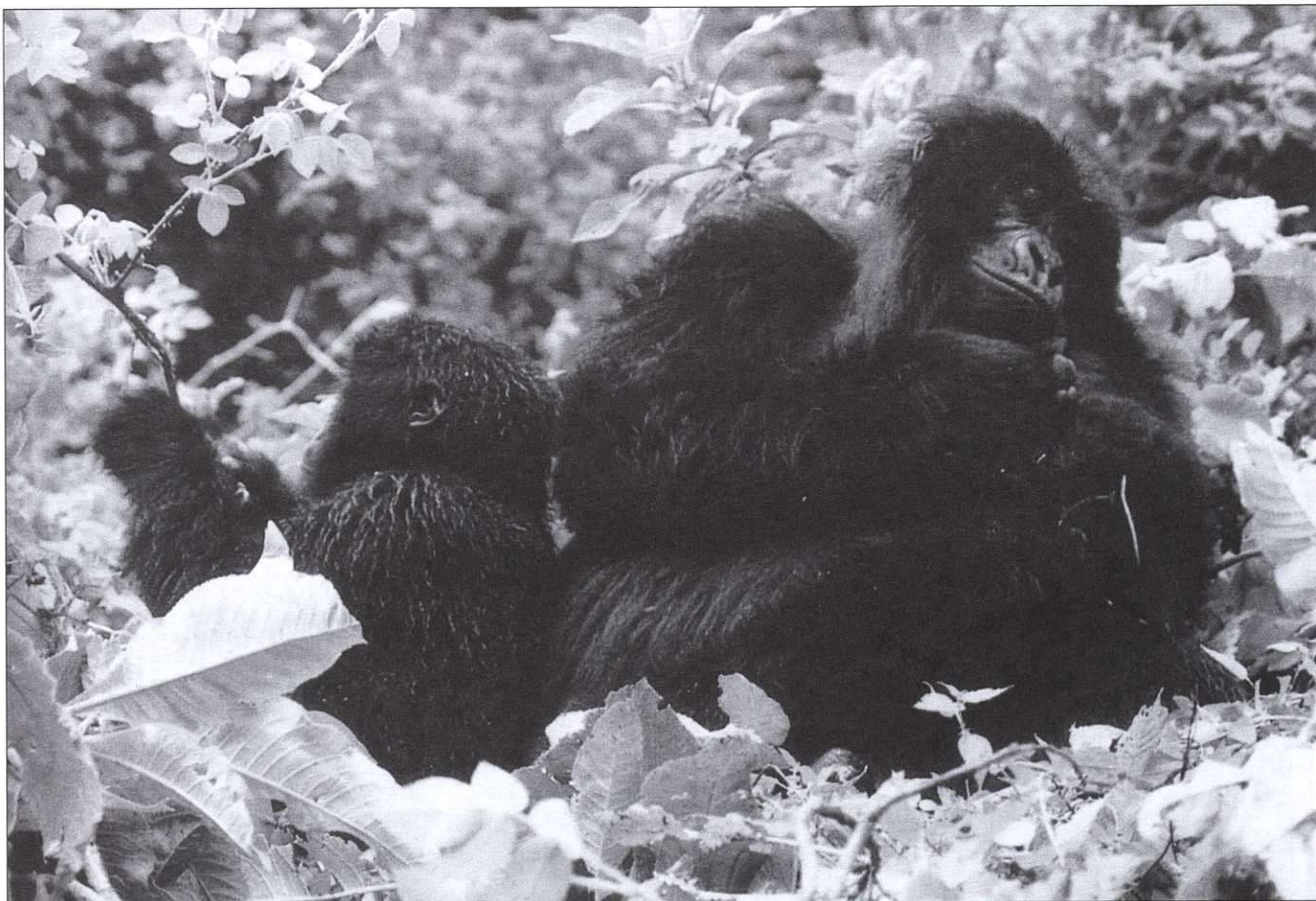
MICHAEL SCOTT, ECOLOGÍA, EDEBÉ, 1995.

juvenil, y es tratada con poca profundidad y mucho desconocimiento todavía, aunque es una parte muy importante de nuestra realidad, que todos quisiéramos que fuera otra.