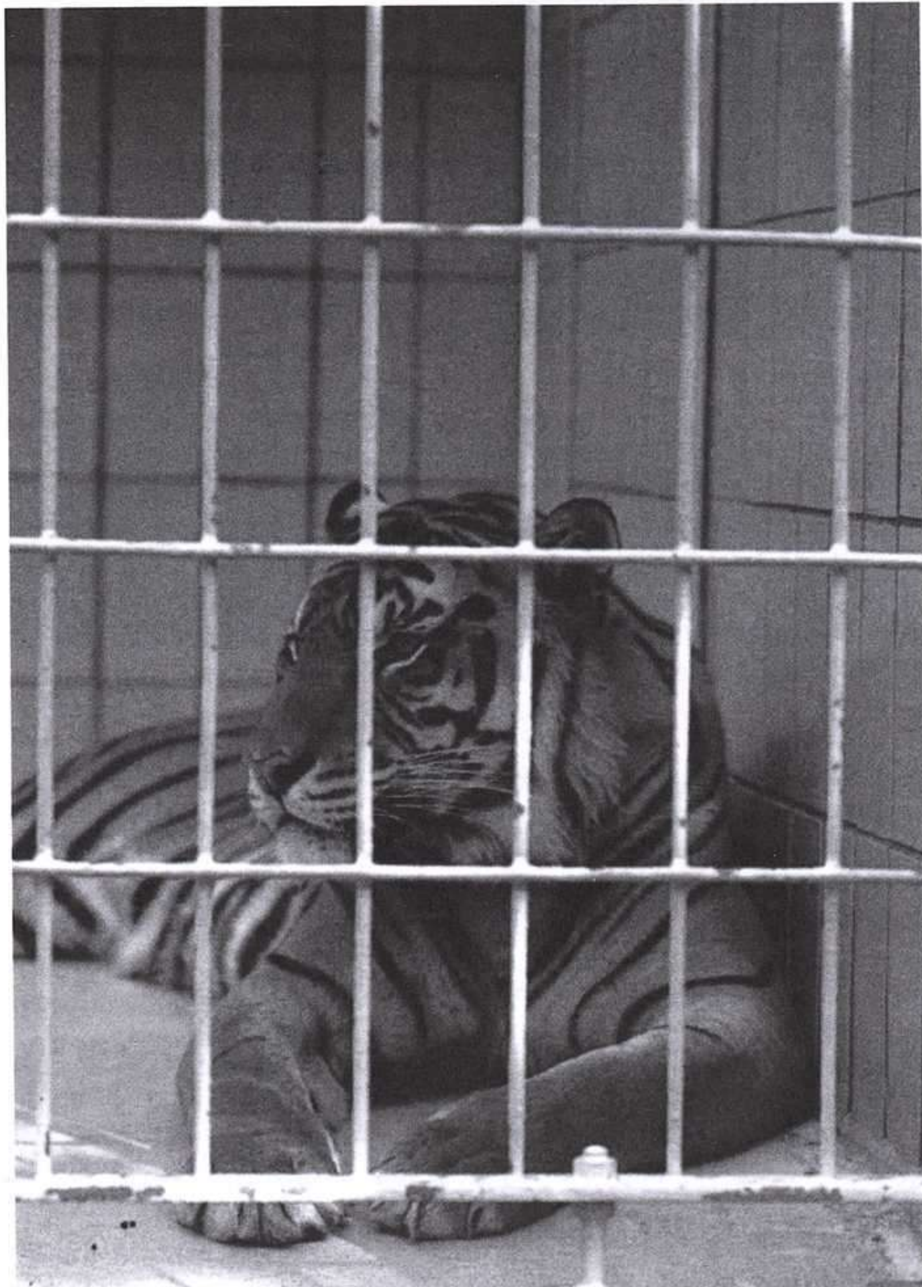
MILES BARTON, ESPECIES EN PELIGRO, EDEIVIVES, 1992.

Acostumbrado durante muchos años a poner en peligro el equilibrio ecológico, el hombre experimenta la fusión nuclear