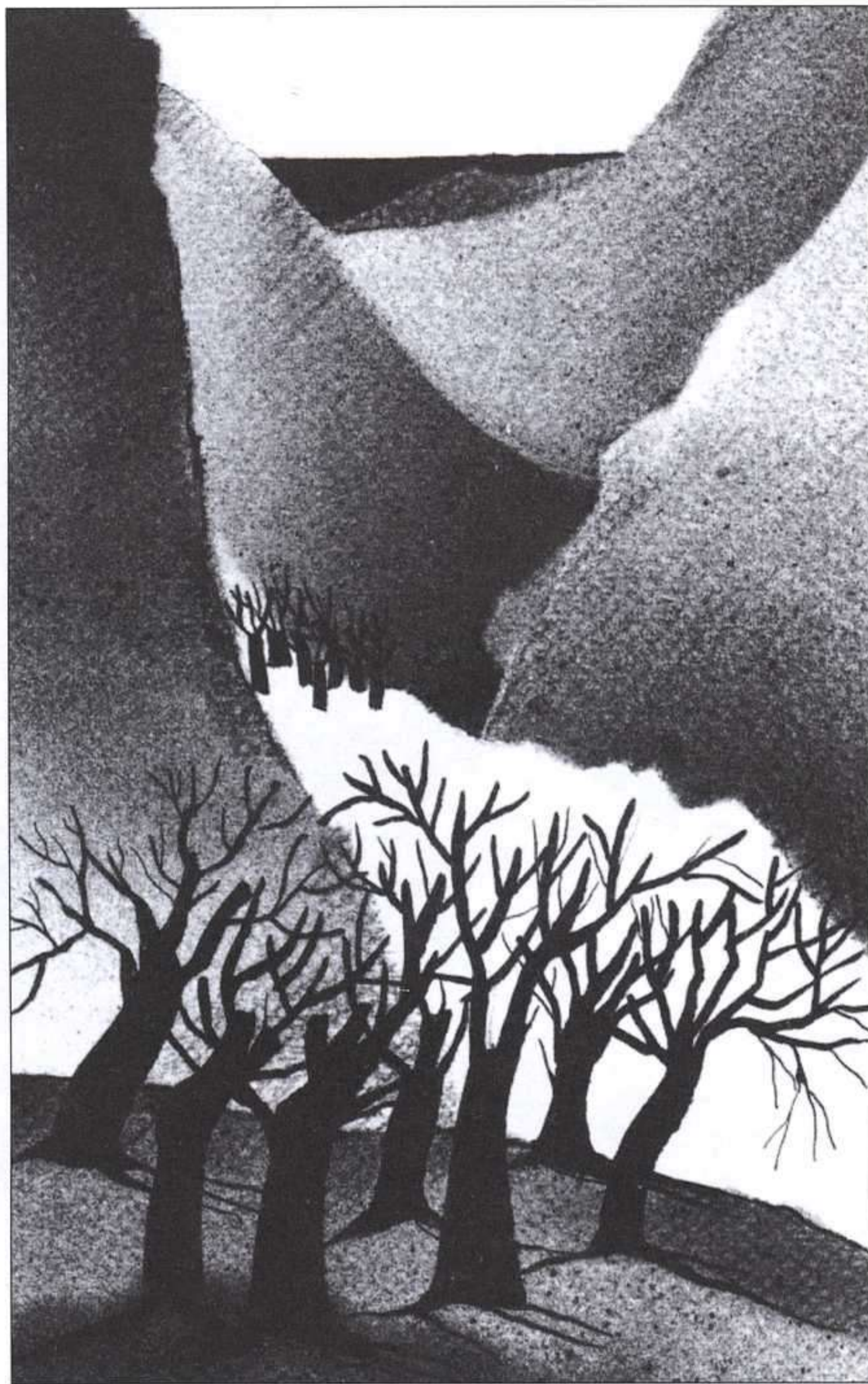
MARAGDA CUSCUELA, TASSIE, EL LLOP AMB PELL DE RIGRE, CRUÏLLA, 1989.

Otro monográfico, esta vez sobre animales en peligro de extinción.