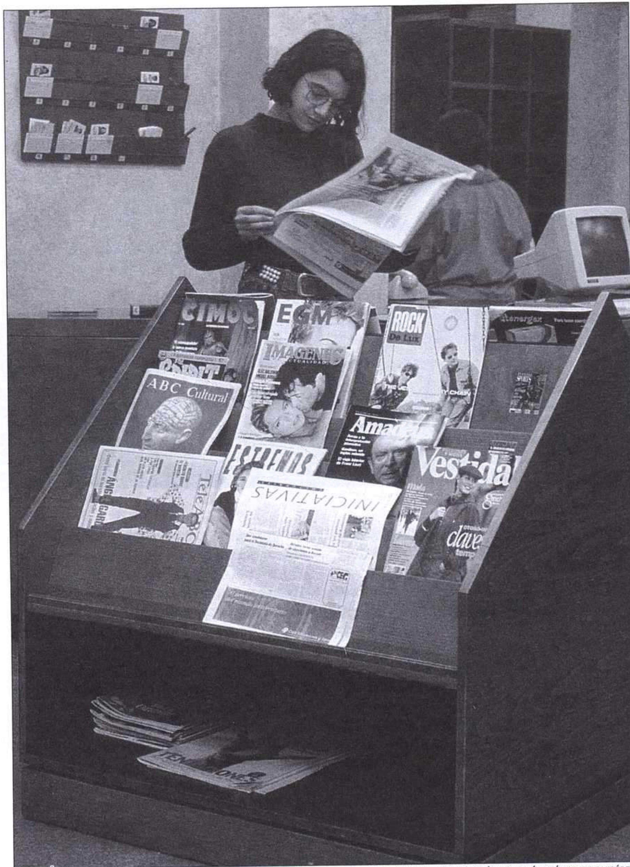
SALA JUVENIL / FUNDACIÓN GERMÁN SÁNCHEZ RUIPÉREZ.

Por otro lado, el desconocimiento de los contextos reales y la ingenua creencia de que las bibliotecas escolares pueden desarrollarse por influencias externas —especialmente con la llegada de un bibliotecario—, al margen de los docentes, de sus tradiciones profesionales y de sus prácticas más arraigadas, así como la equivocada noción de que existe un consenso implícito sobre la necesidad de las bibliotecas escolares, sus funciones y modelo de gestión, ha llevado a la creencia de que no es necesario el esfuerzo de analizar y de argumentar. Por añadidura, quienes siguen pensando que la cuestión se resolvería vía Boletín Oficial, consideran que toda la responsabilidad recae únicamente sobre una