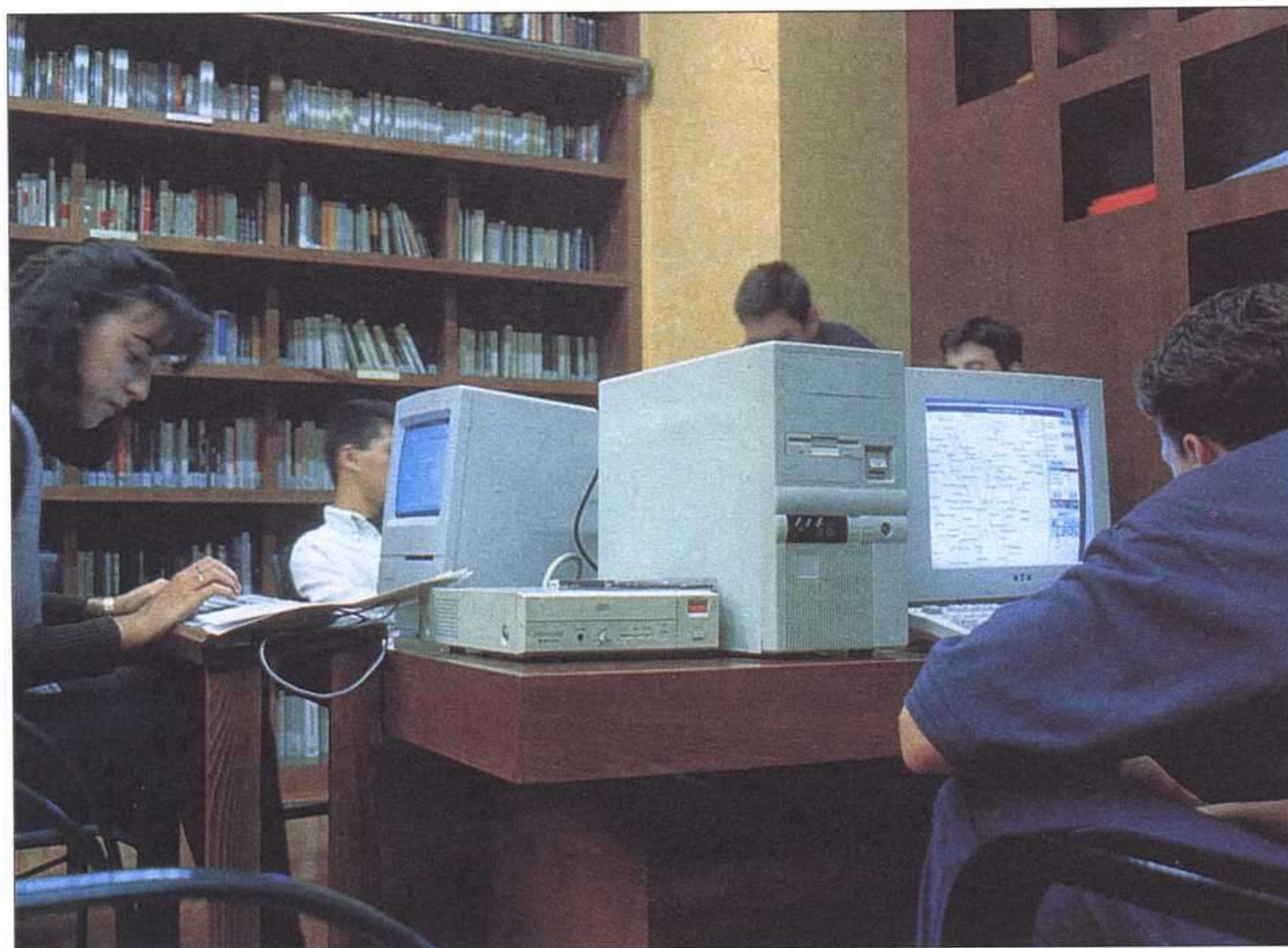
SALA JUVENIL / FUNDACIÓN GERMAN SÁNCHEZ RUIPÉREZ.

den a situaciones, necesidades y tradiciones político-sociales y culturales muy diferentes a las nuestras.