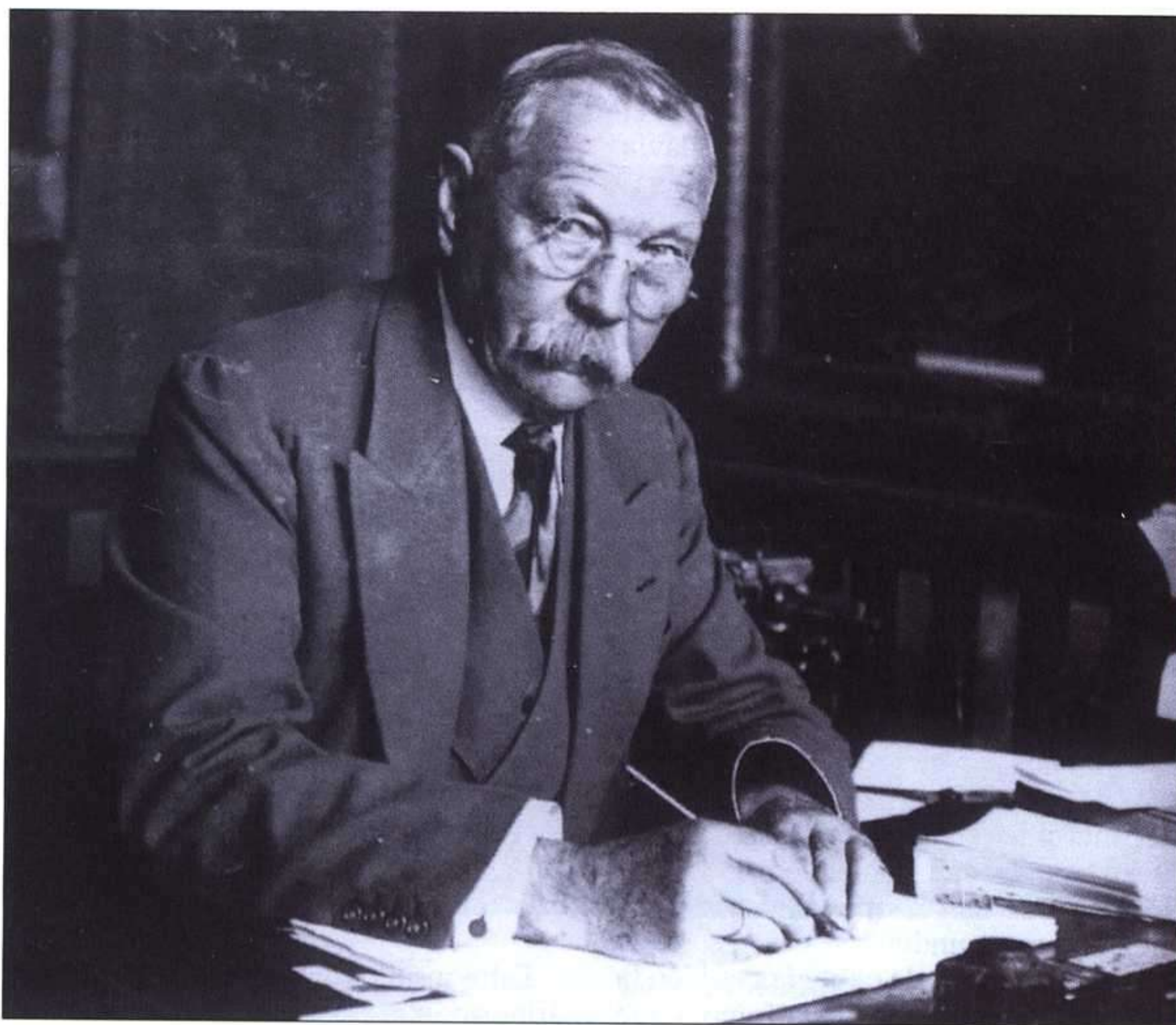
El creador de Sherlock Holmes fotografiado poco antes de su muerte, en 1930. Ese mismo año publicaba The Edge of Unknown , serie de ensayos sobre espiritismo.

1868-1870 El pequeño Arthur es enviado a estudiar a Hodder, la escuela preparatoria antes de ingresar en Stonyhurst, un centro de jesuitas en el que lo aceptarían sin cobrarle, con la esperanza de que después seguiría la carrera eclesiástica.