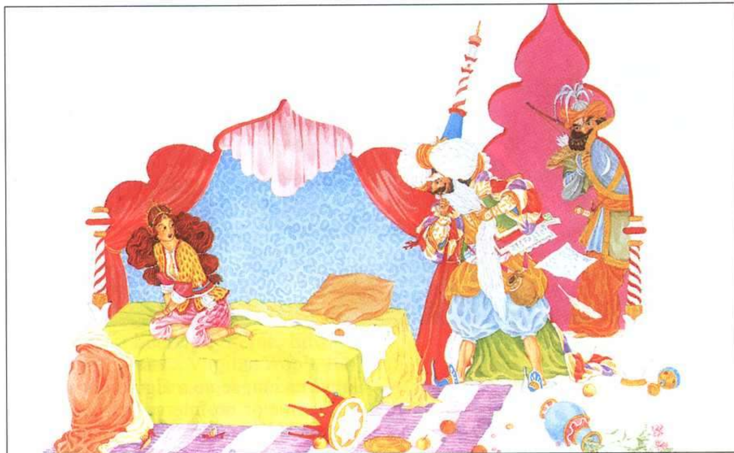
DIMITRI MAKHASHVILI, LAS MIL Y UNA NOCHE, LOS CUENTOS..., PLAZA&JANÉS, 1990.

El lenguaje ha de ser sencillo, aunque imaginativo, lo cual no redundará en un