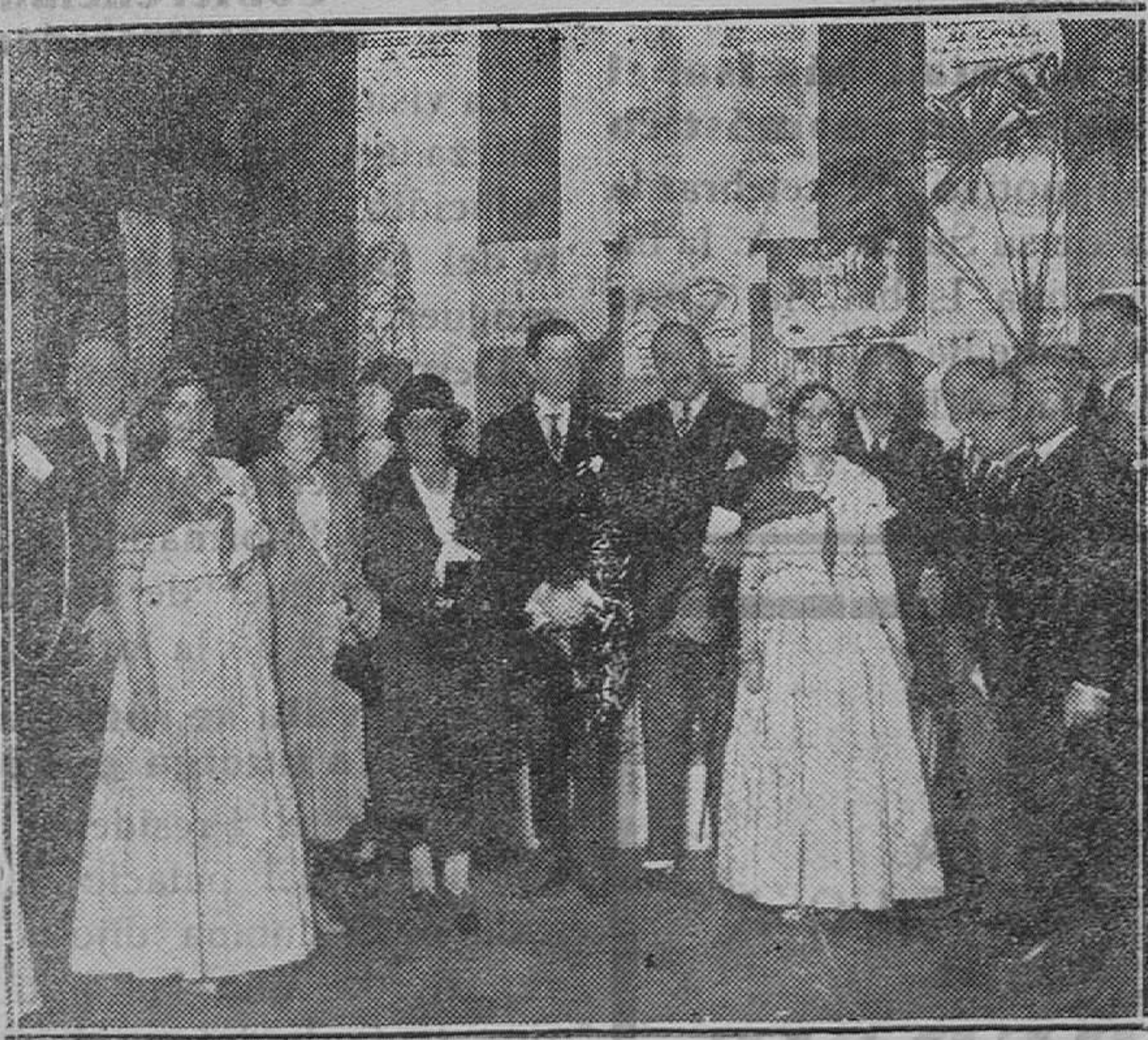
En el Ministerio de Instrucción Pública.—Los Infantes Doña María Luisa y Don Fernando, con el ministro de Instrucción Pública, el ministro de Chile y otras personalidades, en la inauguración de la Exposición de trabajos escolares

Revisión de obras públicas acordando los programas que permitan desarrollar la fuerza de la economía