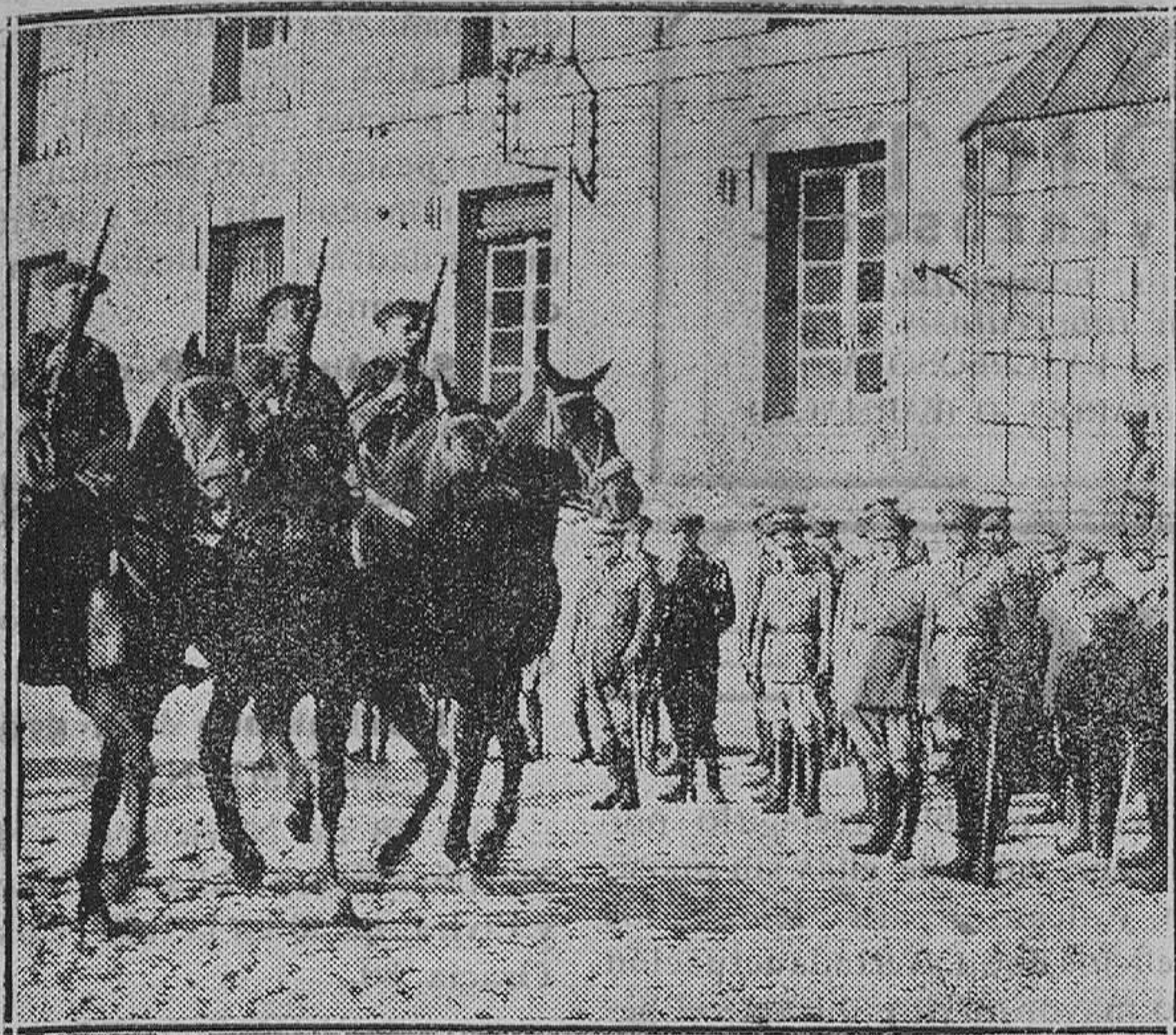
EN EL PARQUE DE INTENDENCIA. — Su Majestad el Rey vistiendo las fuerzas de Intendencia durante la visita efectuada últimamente