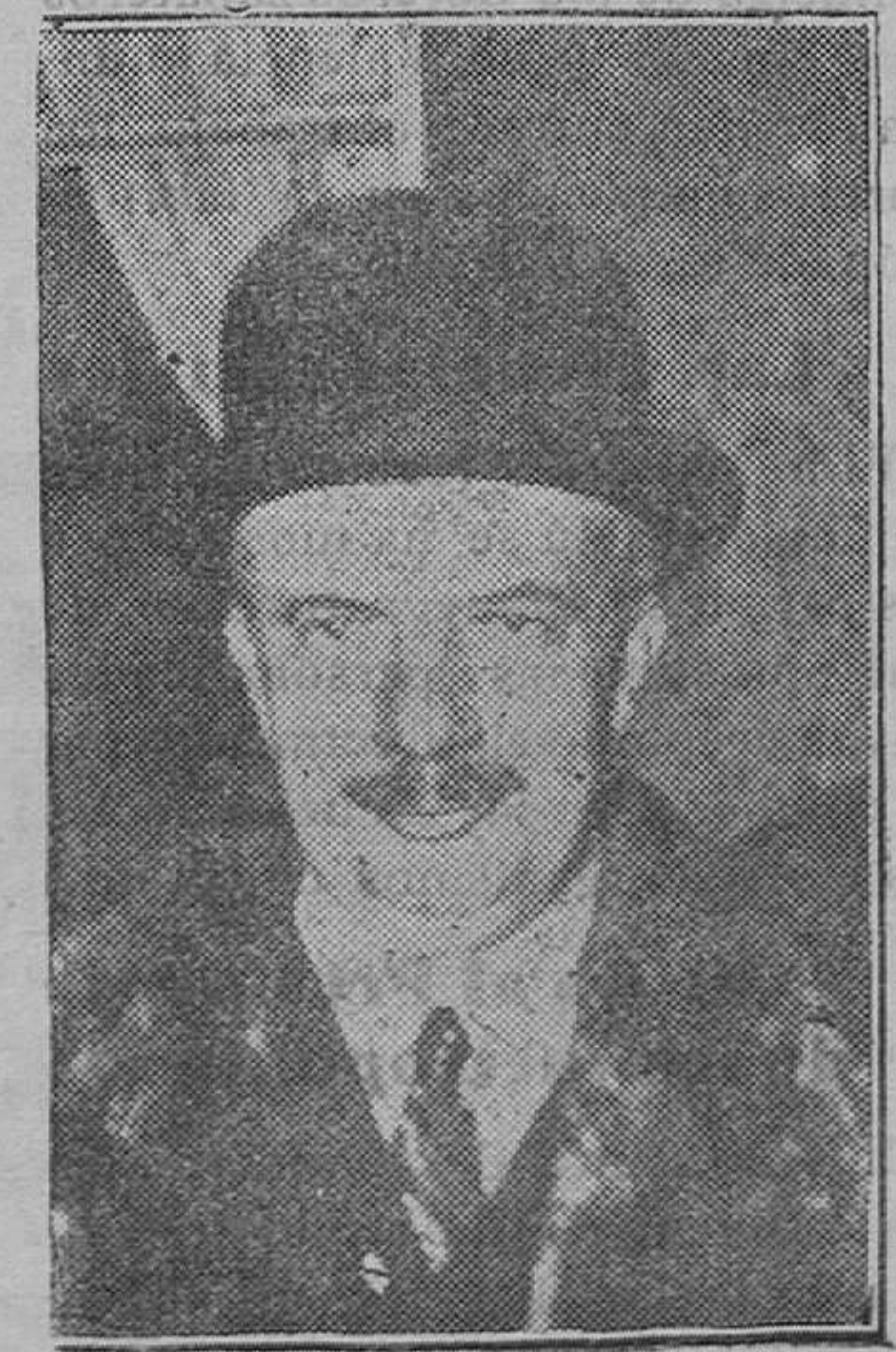
MADRID.—El ministro de la Guerra francés Mr. Maginot, que ha visitado España