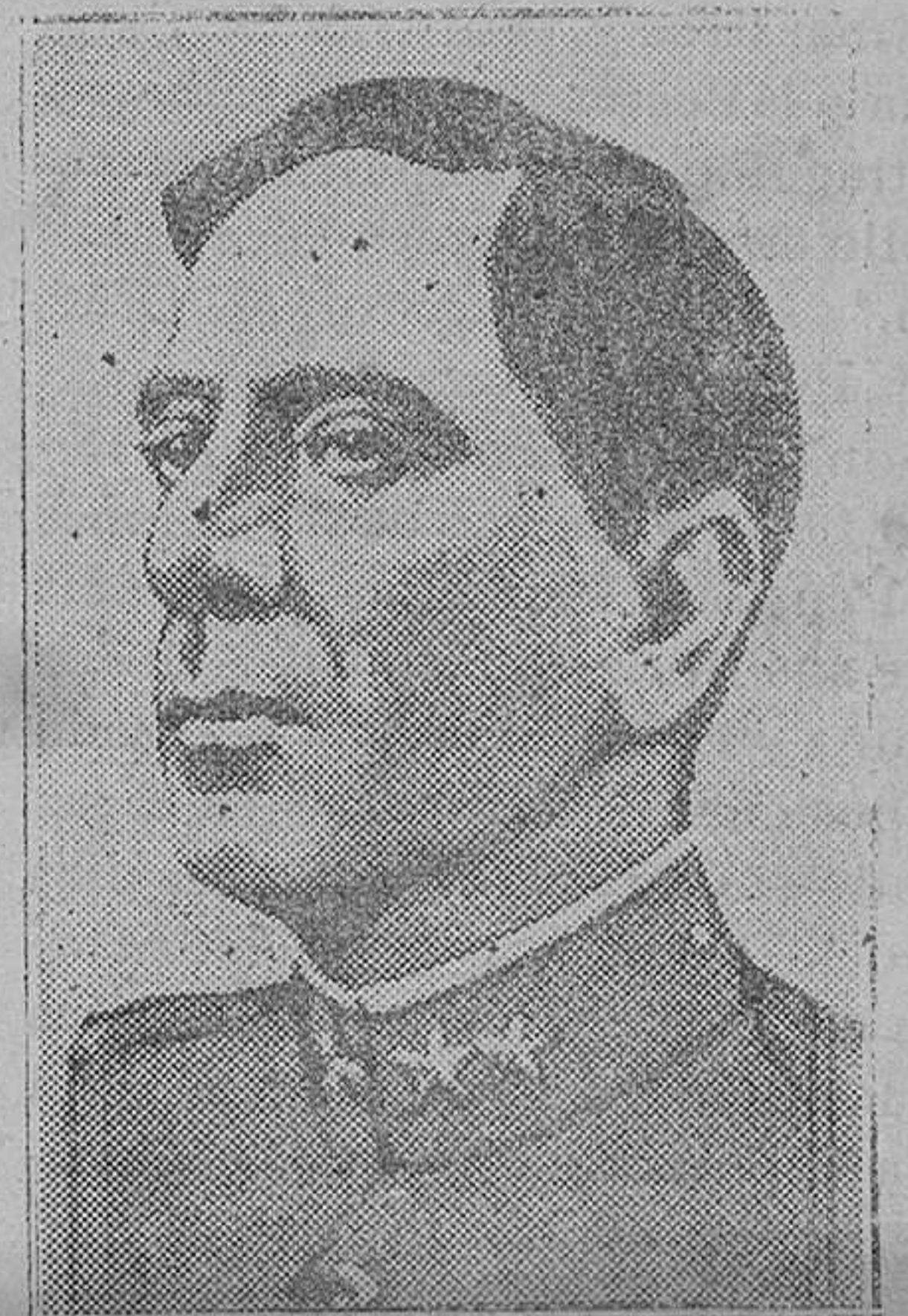
EXTRANJERO.—El antiguo oficial del Ejército argentino Miguel Costa, que con el grado de general, es ahora uno de los jefes del Ejército revolucionario del Brasil