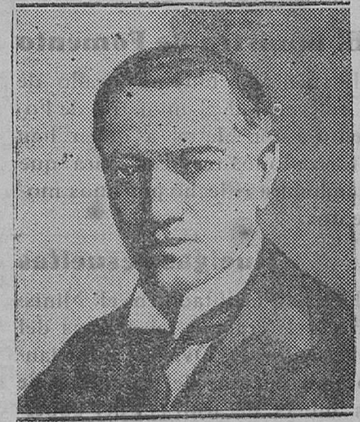
EXTRANJERO.—Lord Amureo, nuevo ministro inglés del Aire

Estas manifestaciones esporádicas de insania de los que han atentado contra la vida de sus semejantes arrebatándoseles airadamente, obligan a la acción más decidida para atajar el mal en sus comienzos, haciendo imposible que se repitan atentados como los que se han registrado en Barcelona y Madrid, reproducción de aquellos afrentosos que contribuían a la vida nacional.