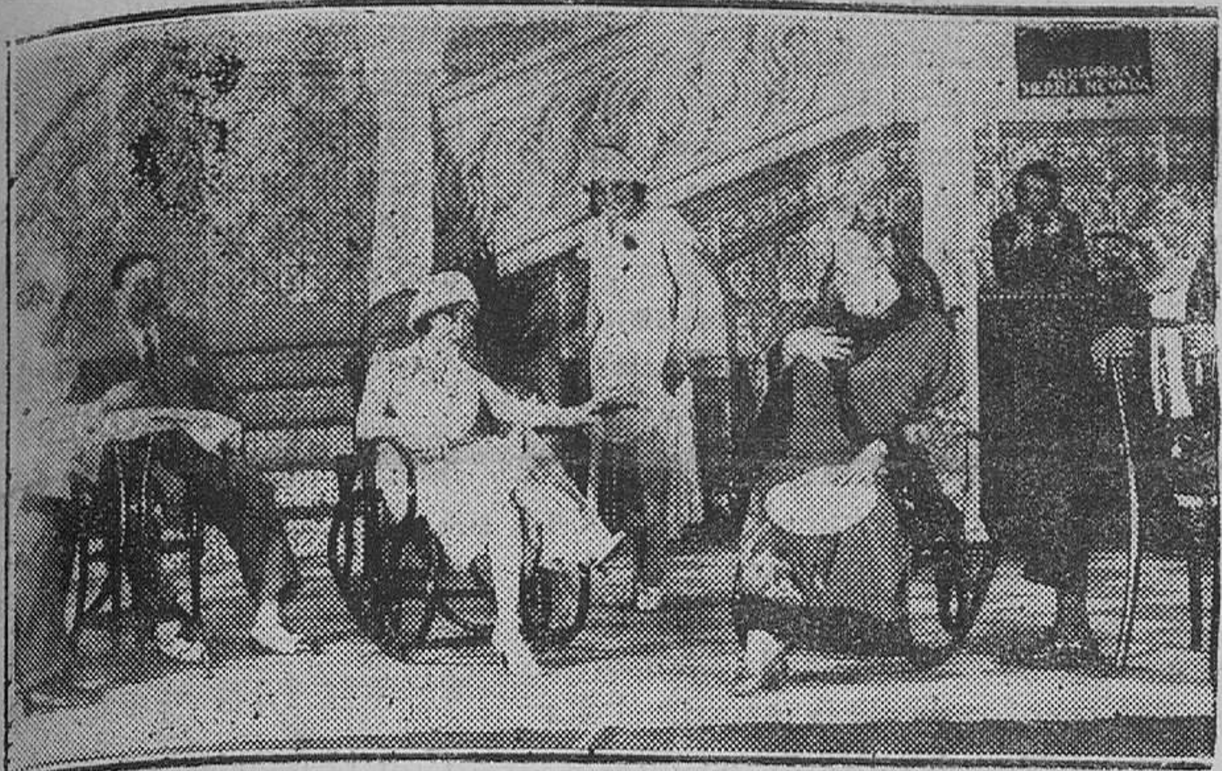
MADRID.—«La perulera», que se estrenó en el Teatro de la Comedia con gran éxito