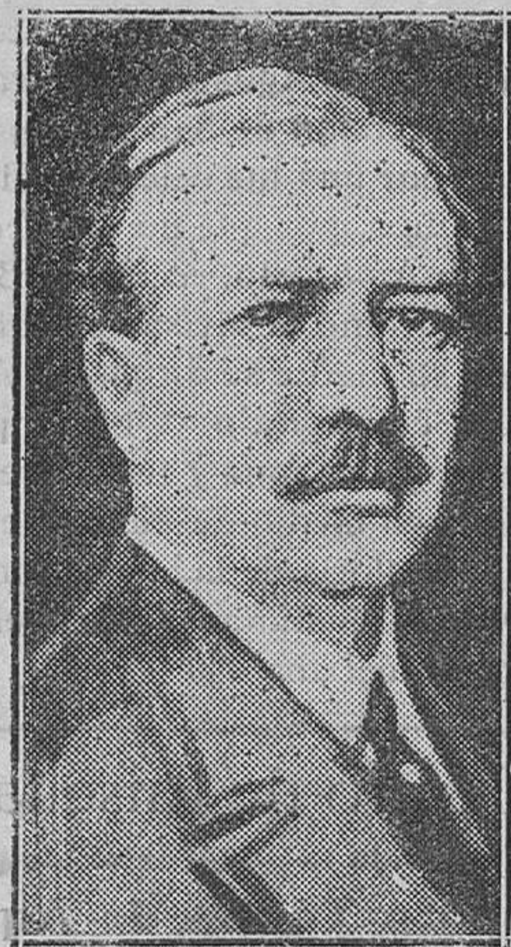
Mr. Maginot, ministro francés de la Guerra, quien en unas recientes declaraciones ha dicho que el Ejército de su país tiene un carácter esencialmente defensivo, pero que no permitirá que se desorganice ni debilite

Pensemos monárquicos todos en nuestra responsabilidad de mañana, aunando nuestros esfuerzos para lograr el triunfo, con el pensamiento de que luchamos por el Rey, que es decir por España, estando en todos momentos con el Rey que fía y espera días prósperos para la Nación, que no los lograría si por acción o omisión nos pusieramos contra el Rey bajando el pensamiento y dejándonos dominar por el egoísmo.