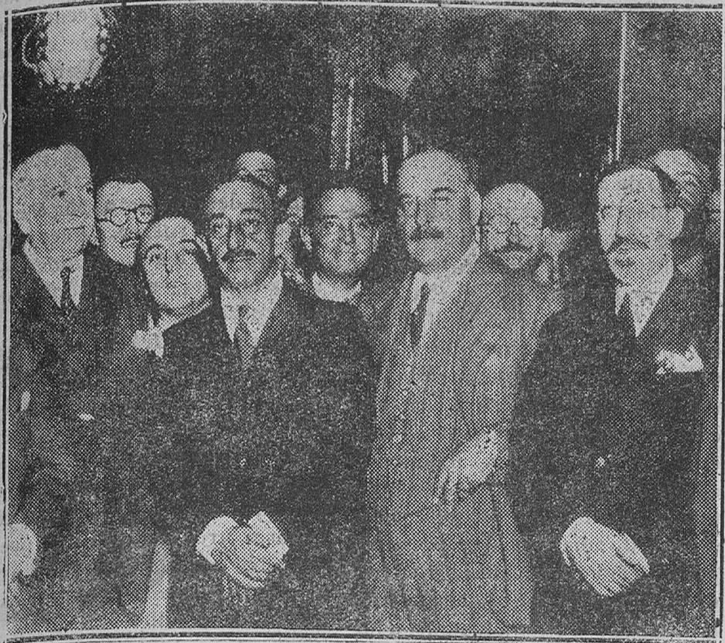
El nuevo ministro de Hacienda, don Julio Wais, después de tomar posesión de su nuevo cargo, rodeado del ministro saliente y del alto personal de la casa