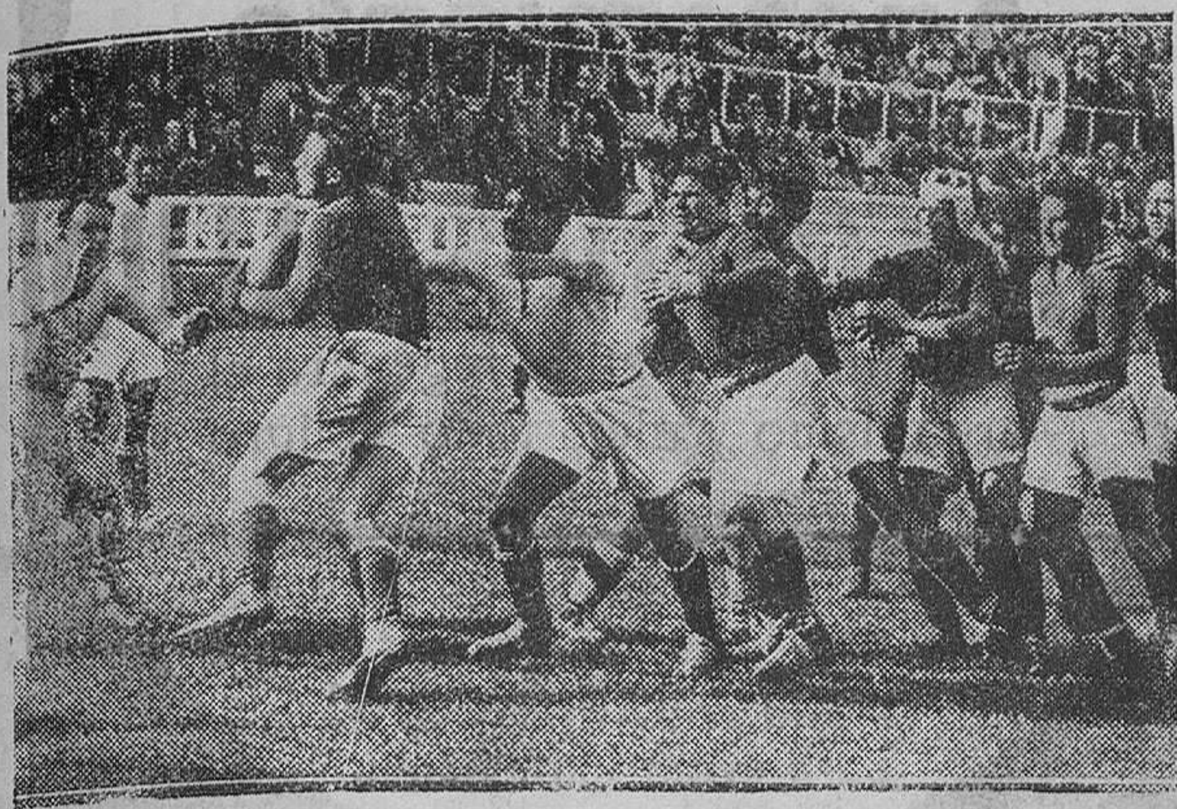
FINAL DEL CAMPEONATO DE ESPAÑA DE RUGBY. - Un momento del partido jugado entre los quince del Madrid y del Barcelona, celebrado en Las Corts