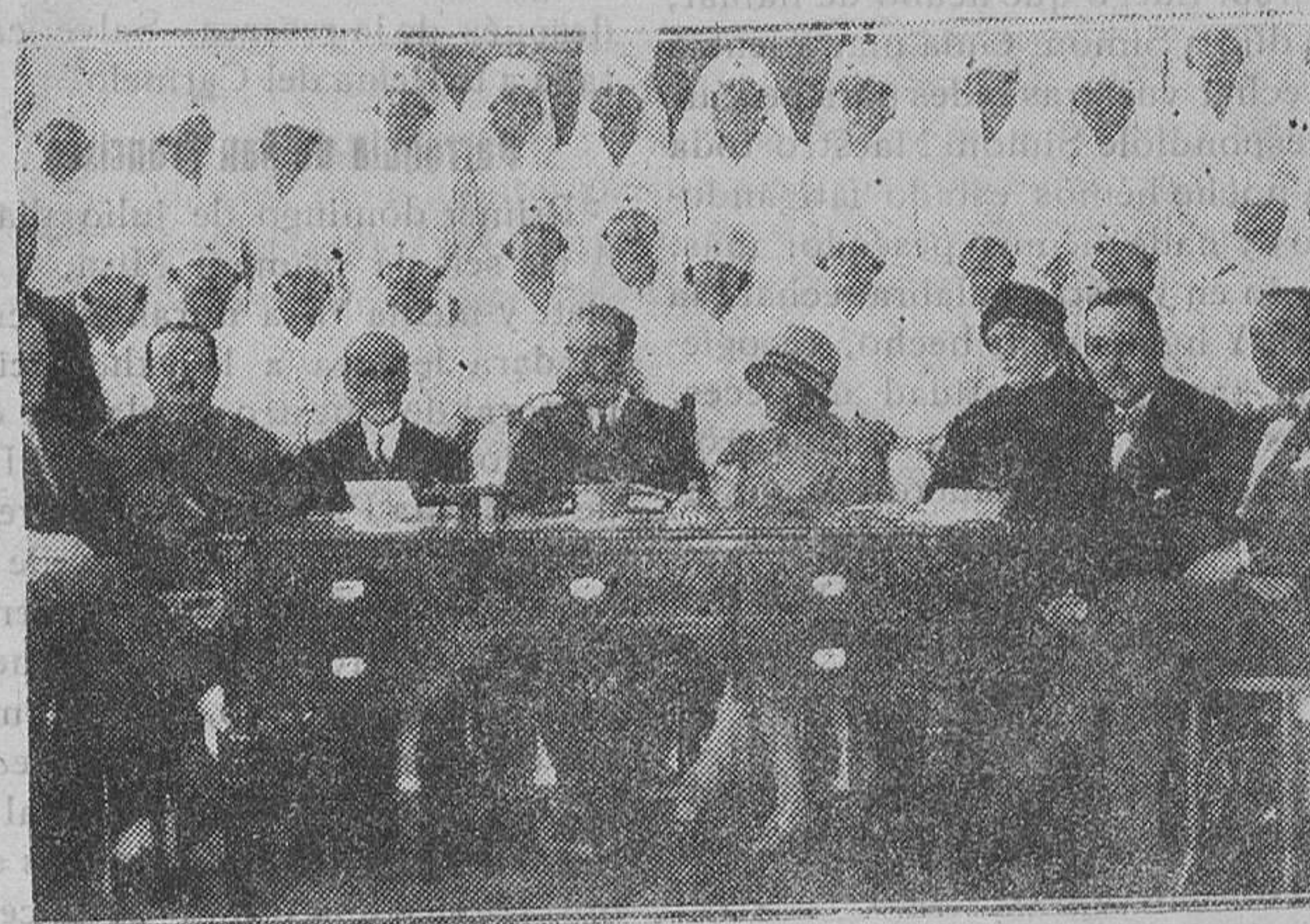
MADRID.—En el Hospital de la Cruz Roja.—Señoritas aprobadas en los exámenes de enfermeras profesionales, reunidas con el Tribunal

Volvamos a Tardieu. Cuando el horizonte ofrece tales objetivos y presenta problemas de tal gravedad, volveremos a «nuestras costumbres y nuestros vocabularios; a disputar como en Bizancio sobre viejas fórmulas heridas en batallas ganadas y a? No, los problemas nacionales son de mayor envergadura. Un Gobierno fuerte, decidido a mantener el orden y la tranquilidad, que pueda presidir en calma el desarrollo de España, iniciado felizmente y que ahora defienden enérgicamente las provincias más atentas a las realidades que a las fórmulas bizantinas o a los rengorres de unas cuantas tertulias. Necesitamos un Poder público dotado de la máxima autoridad. Esto que todas las naciones buscan es más necesario que en ninguna de ellas en España. Y como esto constituye el mayor problema de la hora presente hemos querido ofrecer a nuestros lectores el ejemplo de otros países. Pero tan solo para que sirva de meditación y no de modelo al que copiar servilmente.