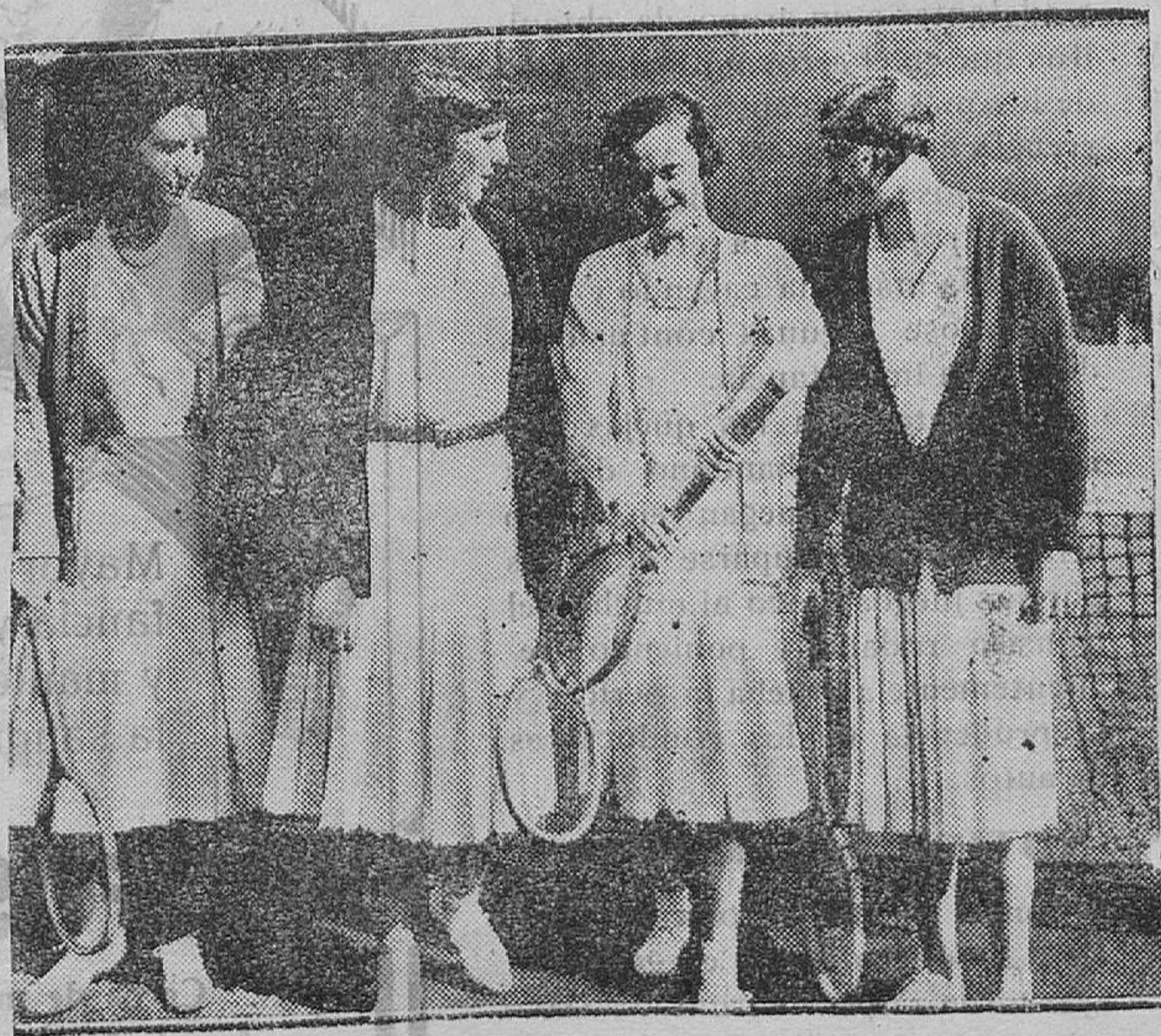
AUGUSTAS PARTICIPANTES EN LOS CAMPEONATOS DE ESPAÑA DE TENNIS.—Las Infantas Doña Cristina y Doña Beatriz y las señoritas de Satriestegui y de Moxó, antes del match de parejas (damas), correspondientes a los Campeonatos de España, en el que las augustas tenistas ganaron fácilmente por 6-2 y 6-3

Fuerte el símil que ha querido presentar el ministro de la Gobernación, pero no creemos que ese afán alborotador sea originado por la no filiación política del actual Gobierno. Las multitudes se ha di-