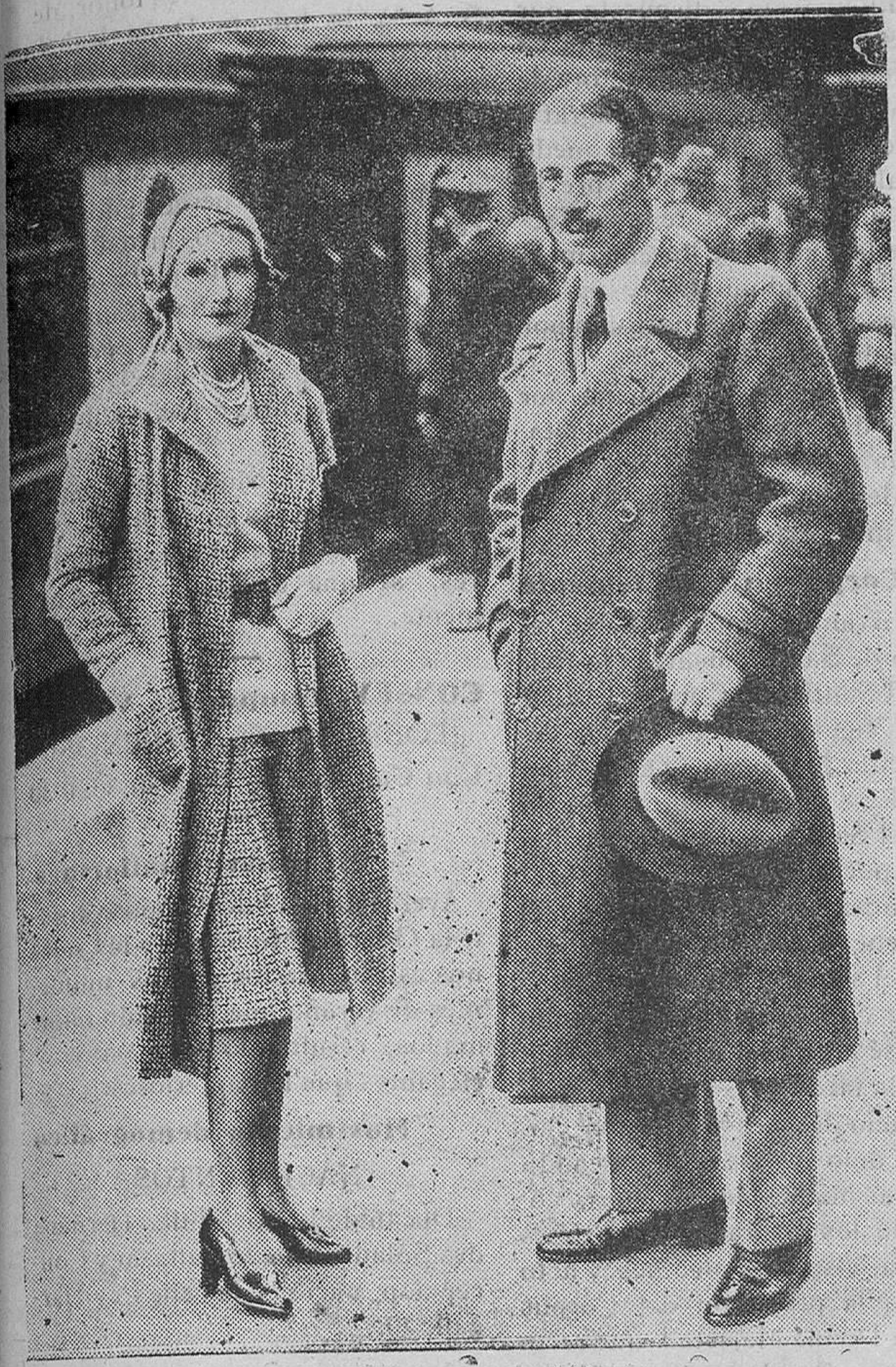
AMIGOS SINCEROS DE ESPAÑA. — Lady Inverclyde, distinguida actriz y escritora inglesa, y su esposo, regresan a Londres después de una deliciosa e inolvidable vacación en España. —Lady Inverclyde ha sido solicitada por una empresa londinense para filmar una película hablada con asunto español

JOAQUÍN MARÍA DE NADAL (Del «Diario de Barcelona»).