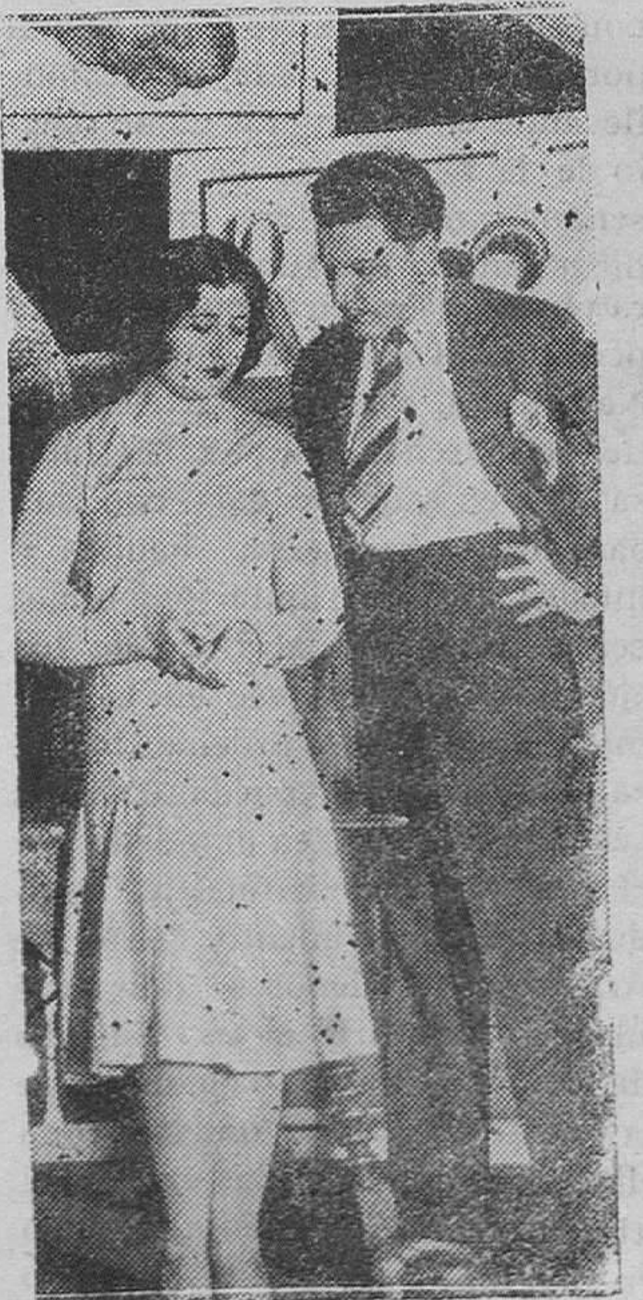
MADRID. — Una escena de la comedia «La casa de naipes», estrenada en el Teatro Español

Véndense en la Librería de Manuel Sintes Rotger, Plaza del Príncipe 17, Mahón.