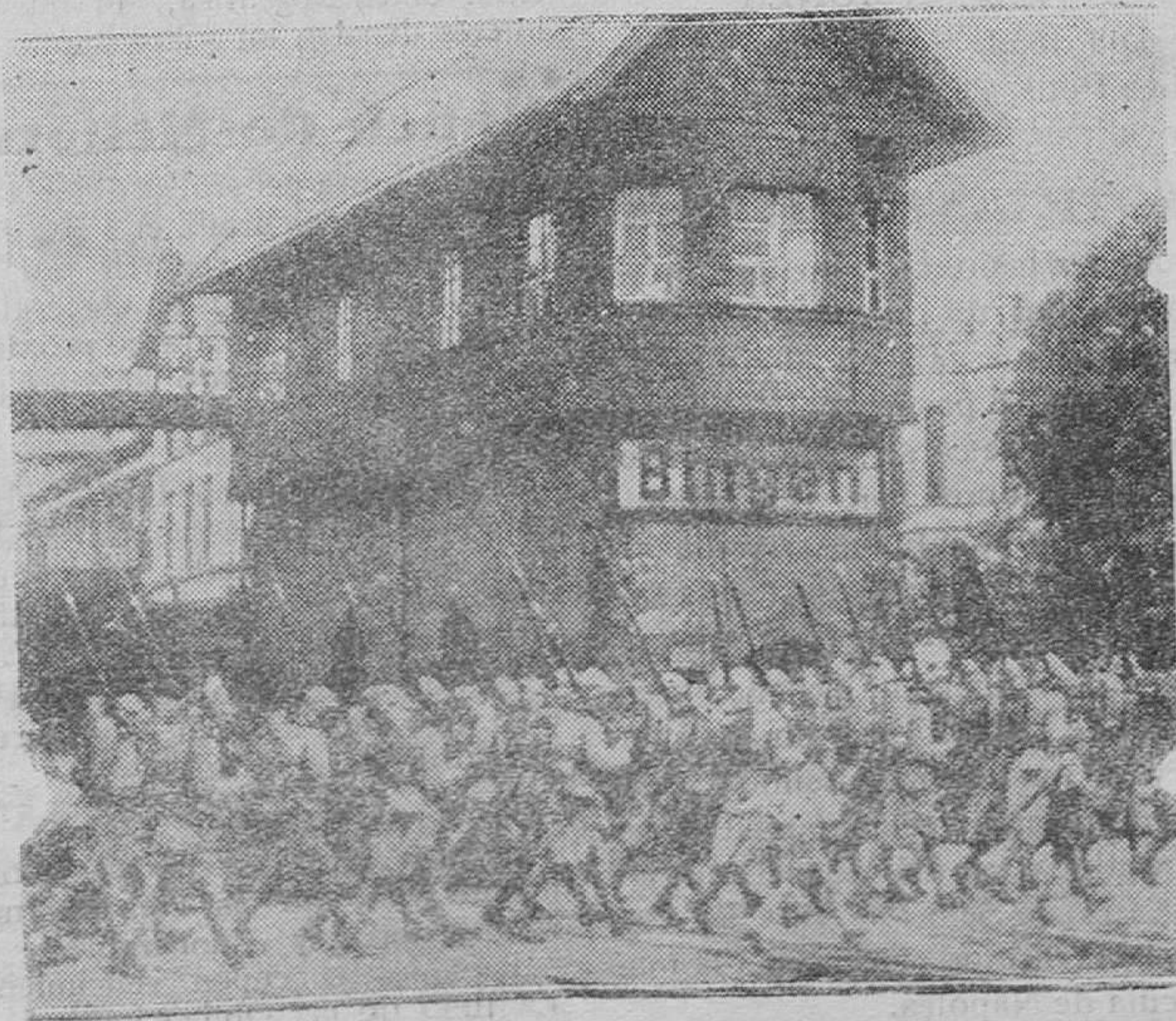
EXTRANJERO.—Dentro de pocos días, el 30 del corriente mes, la evacuación completa de Renania será un hecho.—He aquí la salida de las tropas francesas de la ciudad de Bingen, una de las localidades evacuadas estos días

Pero además durante los últimos meses ha ocurrido en las embajadas y oficinas soviéticas esparcidas por Europa una serie de incidentes que demuestran la ausencia en Rusia de toda garantía jurídica en cuanto a las personas: un día el encargado de Negocios Extranjeros de París huye de la Legación para salvar la vida y no regresa a Moscú. Diversos funcionarios abandonan después sus puestos y prefieren vivir en la emigración antes que afrontar los tribunales de Rusia. Este mismo hecho se repite en Berlín, en Londres y en Estocolmo. Pasan quizás de dos docenas los casos conocidos. No podemos atribuir esta actitud a que todos esos funcionarios sean realmente culpables de corrupción administrativa. Si fuesen delictos comunes, los soviets hubieran podido recurrir a los tribunales de justicia de cada nación, como hicieron con el asunto Litvinof. No es por lo mismo temerario suponer que en el régimen soviético la justicia carece de las más elementales garantías existentes en las naciones civilizadas. El terror ruso es algo más que una invención de los emigrados o de determinados capitalistas.