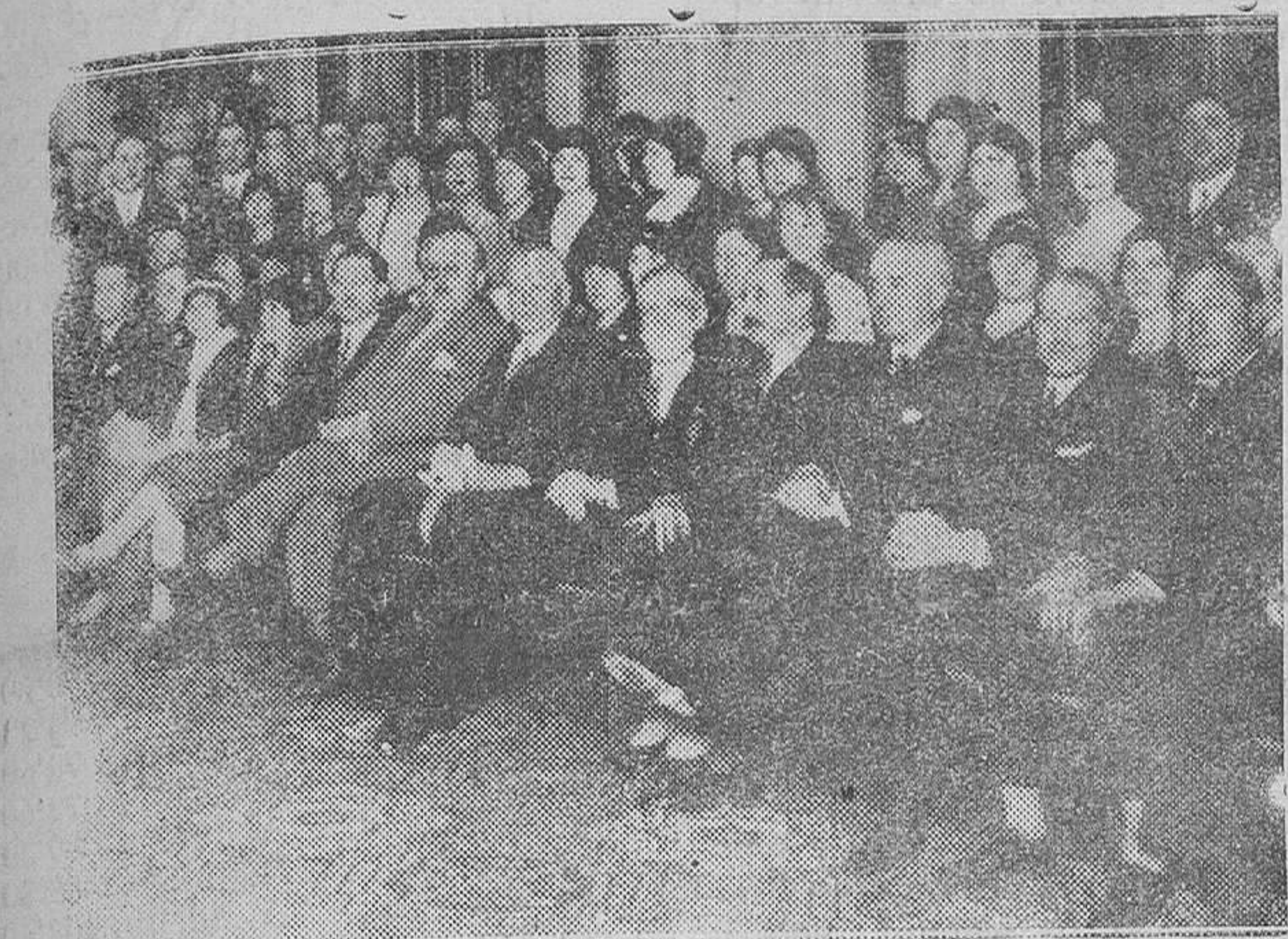
MADRID.—Del Congreso Nacional de Abogados.—Recepción celebrada en el Ayuntamiento en honor de los congresistas