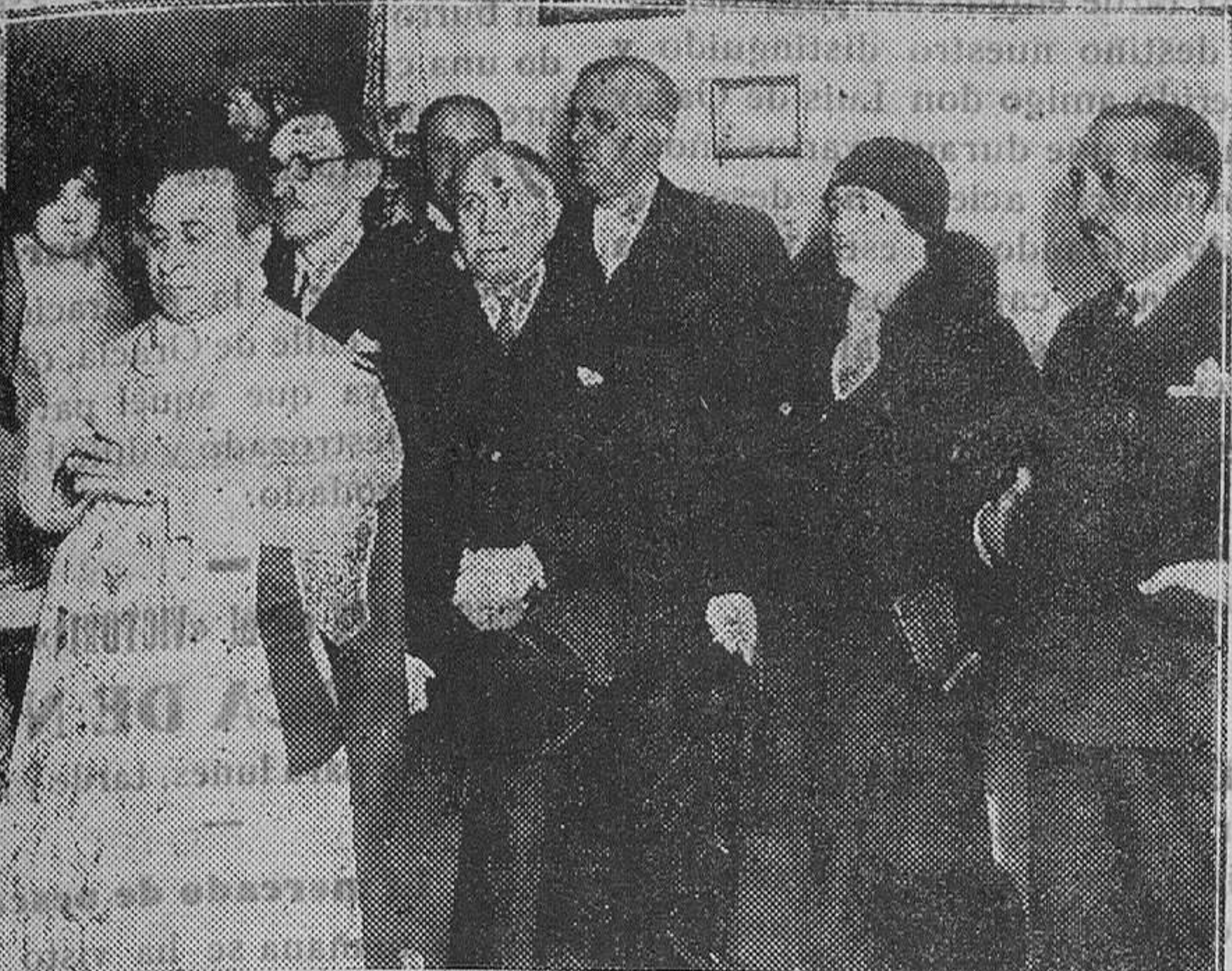
MADRID.—Comisión de las reclusas de la Prisión de Mujeres.—A la solemnidad religiosa asistieron el ministro de Justicia y Culto, el Director General de Prisiones señor Betancourt, el Director y altos empleados del Establecimiento y otras personalidades.

Para obtener cantidad y calidad es preciso ir a la selección de razas y dentro de esta selección a la perfección de los ejemplares, cuidando mucho la nutrición que es esencialísima y de ella depende en gran parte la producción. Detalló las características de las razas lecheras y la norma adecuada para la alimentación de las mismas y pasa después a ocuparse de la obligación del productor de ofrecer al mercado un producto excelente. Para ello es preciso la más escrupulosa limpieza, pues la leche está ameznada por muchos elementos extraños que recoge después de salir de la vaca y que determina su contaminación que se traduce en fermentaciones que la hacen después inútil para el consumo, lo que representa serio quebranto para el productor. Detalla las medidas de higiene que debe tener presente el agricultor al sacar la leche y después antes de llevarla al mercado. Trata después de las garantías que ha de tener el productor de que su artículo no podrá ser rechaza-