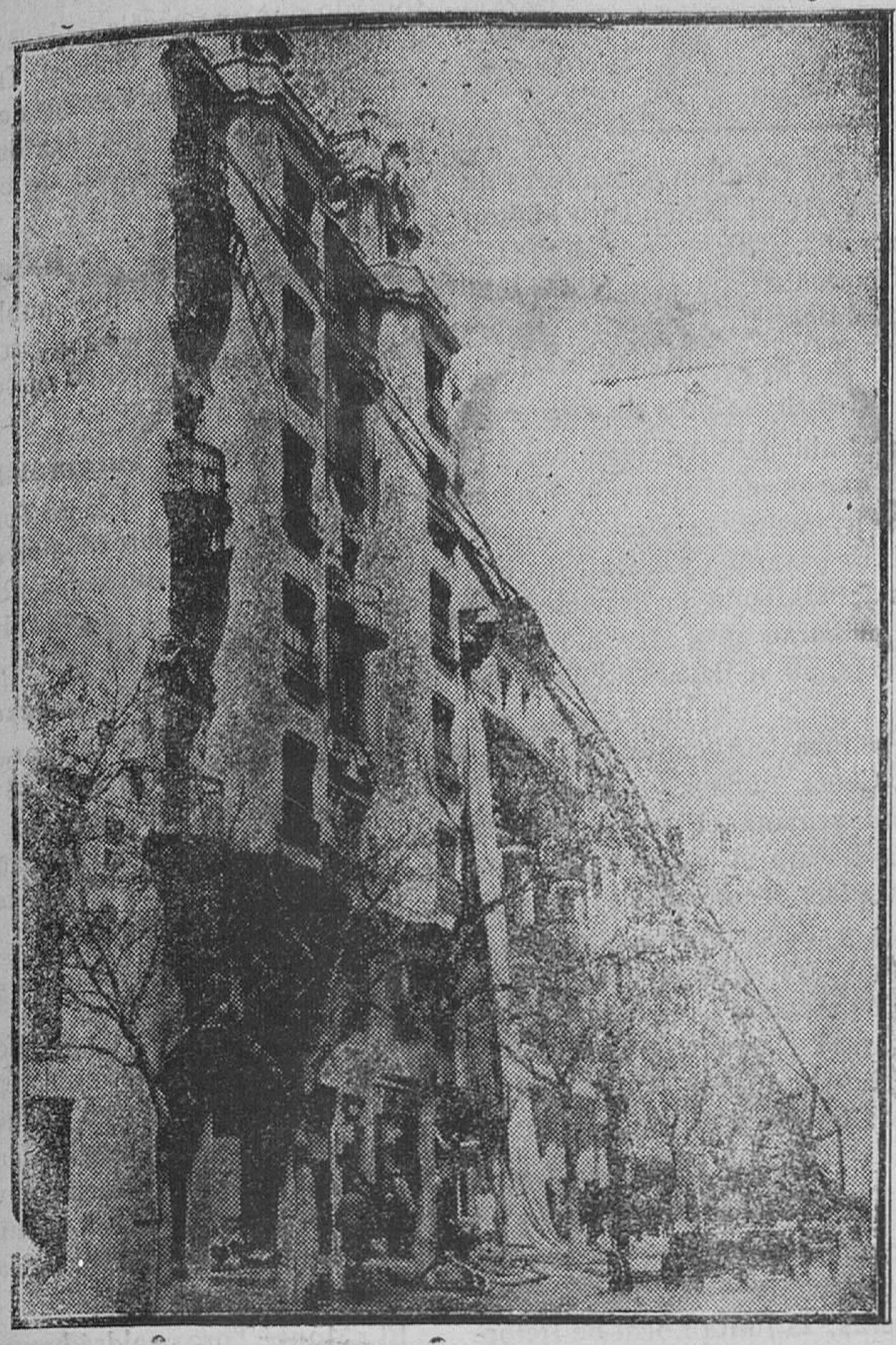
MADRID.—Un aspecto del formidable incendio producido en una casa de 11 calle Alcalá

Aprobar varias cuentas. Manifestar a la Eléctrica Mahonesa que la Permanente estima lógico corra a cargo de dicha enti-