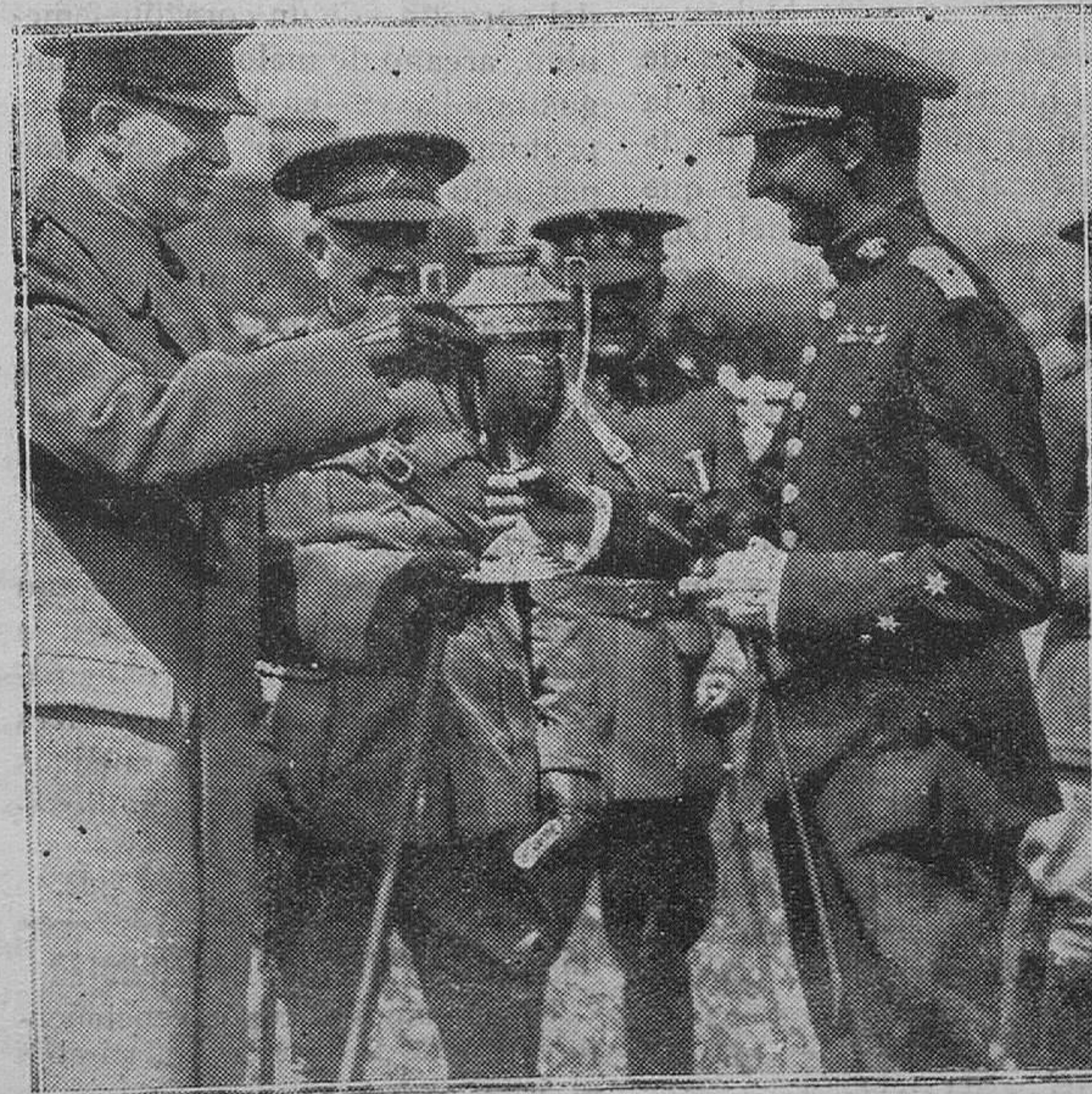
MADRID.—El Infante Don Fernando entregando la copa del Campeonato de Caballos de Armas al capitán Navarro, ganador de tan precioso trofeo