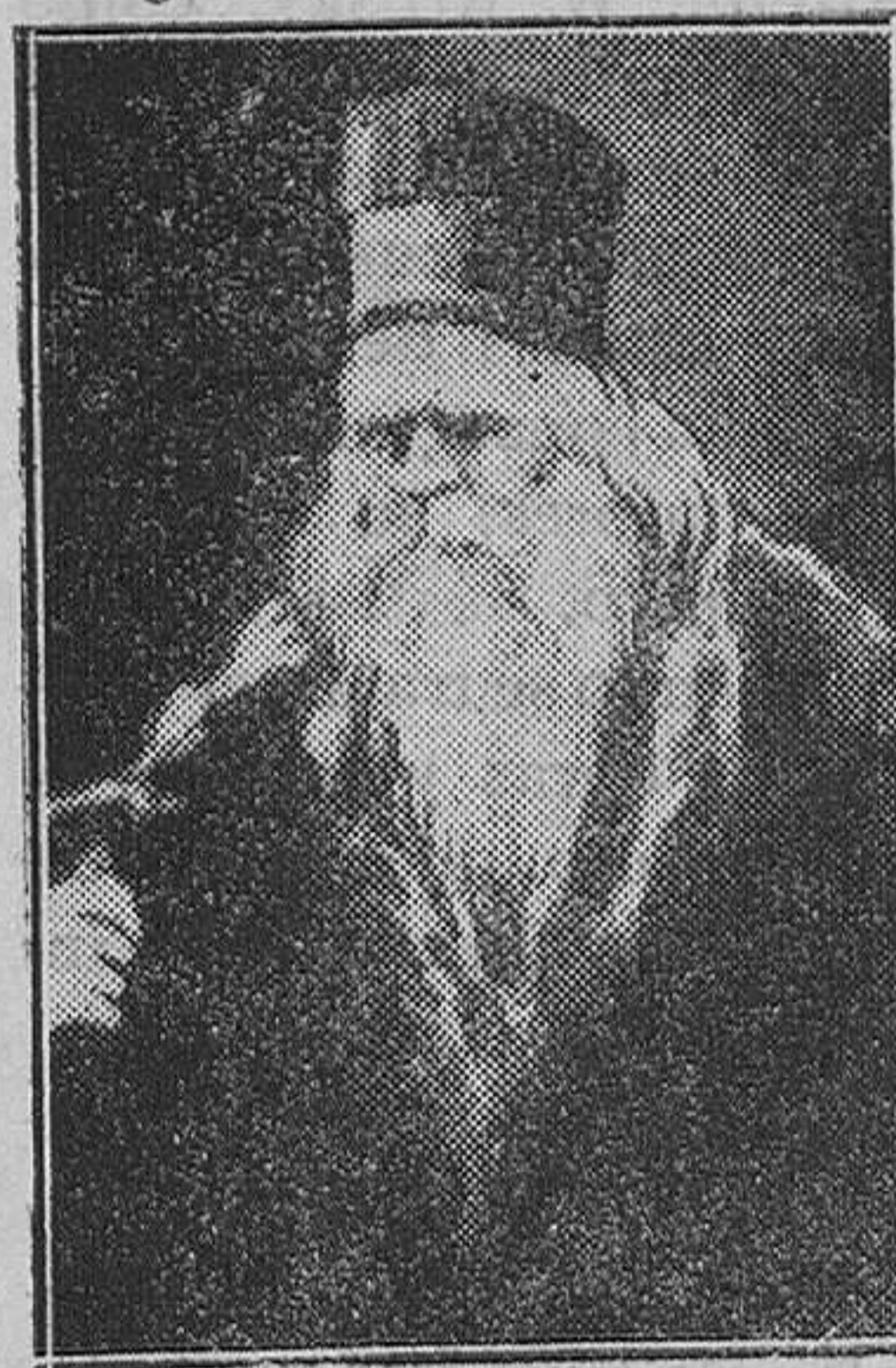
EXTRANJERO.—Dimitrie, el Patriarca de la Iglesia serbia, fallecido recientemente en Belgrado

La revolución rusa inspiró a Nicolás Berdiaeff consideraciones semejantes en su libro «Una nueva Edad Media». «Toda revolución—dice Berdiaeff—es una descomposición progresiva de la sociedad y de la vieja cultura. Las concepciones que representan una revolución, según un ideal y según normas, deben ser enteramente abandonadas. La revolución no es nunca tal como debió ser, porque no hay revolución obligatoria: una revolución no puede ser una obligación. La revolución es la fatalidad sobre