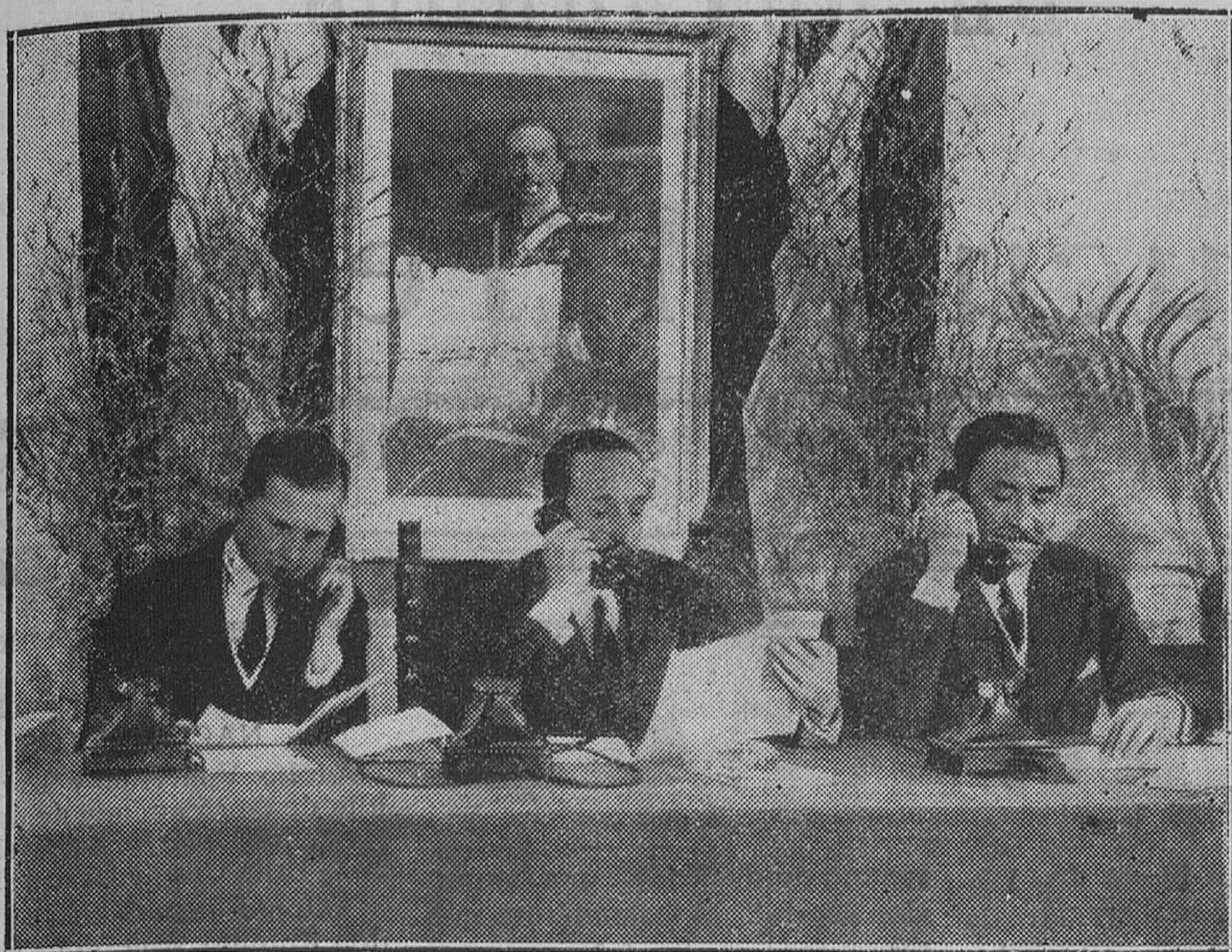
MADRID.—La inauguración del servicio telefónico con Chile.—Su Majestad el Rey hablando con el Presidente de la República chilena señor Ibáñez.—A la derecha e izquierda del Soberano el Infante Don Fernando y el Jefe del Gobierno