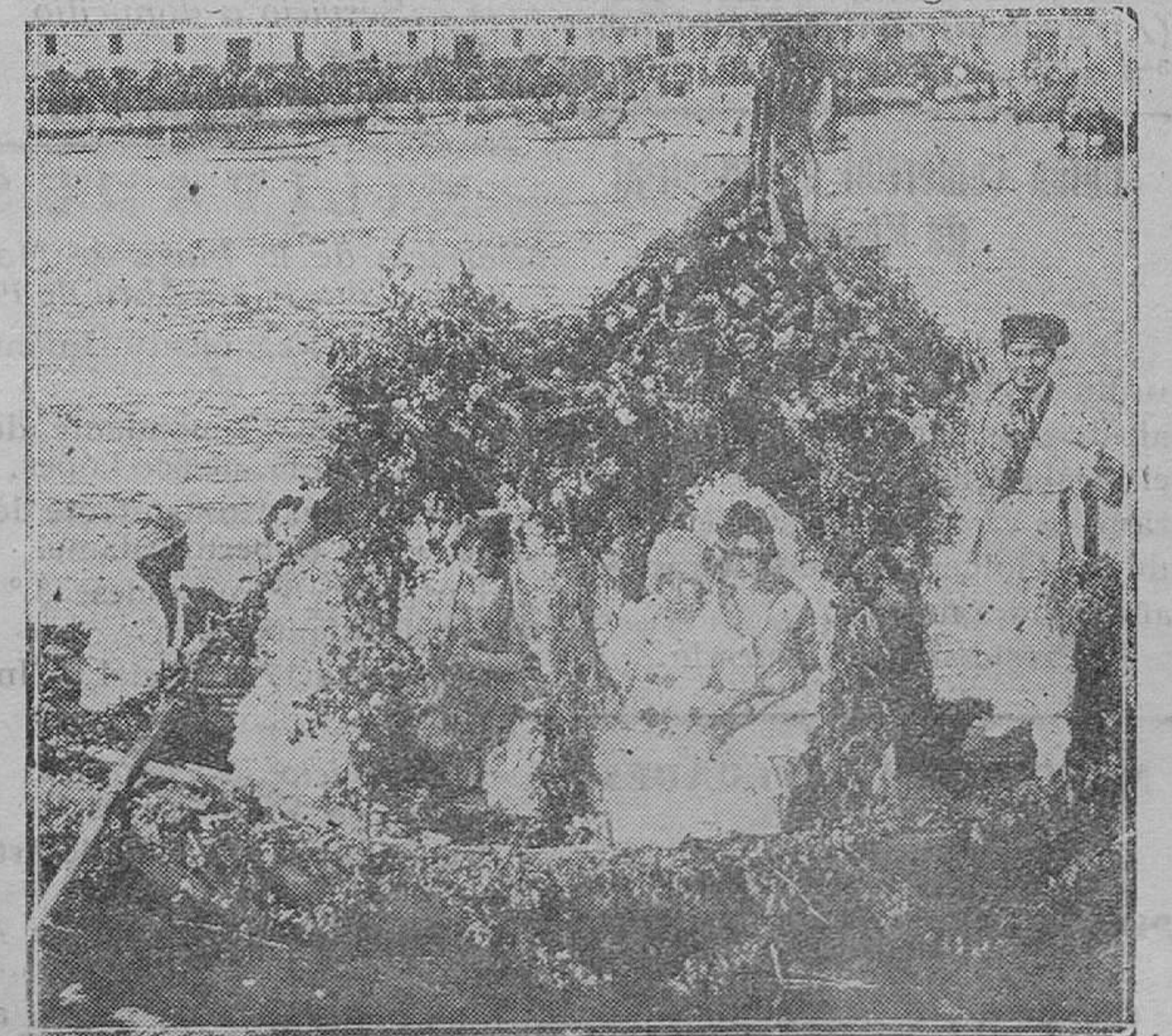
FRANCIA.—La Riviera, con permiso de las personas adineradas, ha recibido la visita de la señorita Primavera, y celebrará su llegada con una batalla de flores