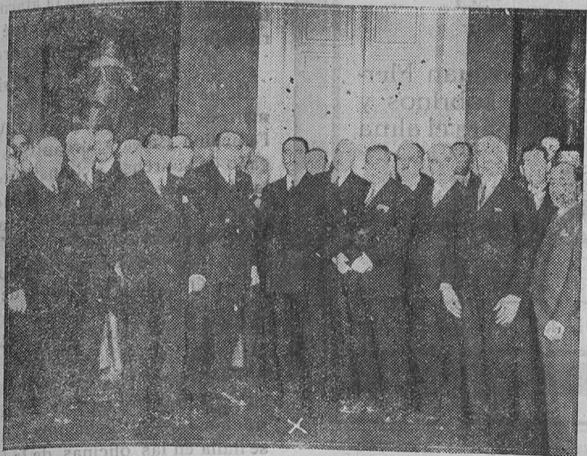
MADRID. — El general Berenguer con los nuevos Gobernadores civiles en el Palacio de la Presidencia