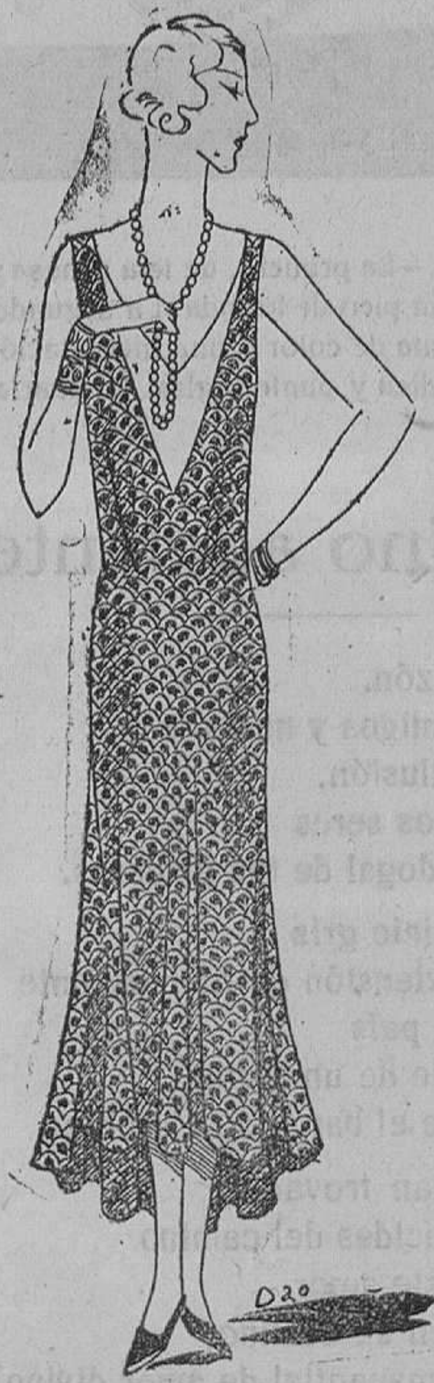
Vestido de puntilla negra, clareado por un forro de satén beige.

La cintura suele señalarse con grandes grupos de frunces que se estiran en sentido de la longitud y se sujetan, sea por un hilo parado, sea por una tira de tela del vestido, puesta también en el sentido de la anchura. El cuerpo es llano, escotado con discreción. En algunos modelos hay grandes bertas de encaje, que cubren el arranque del brazo.