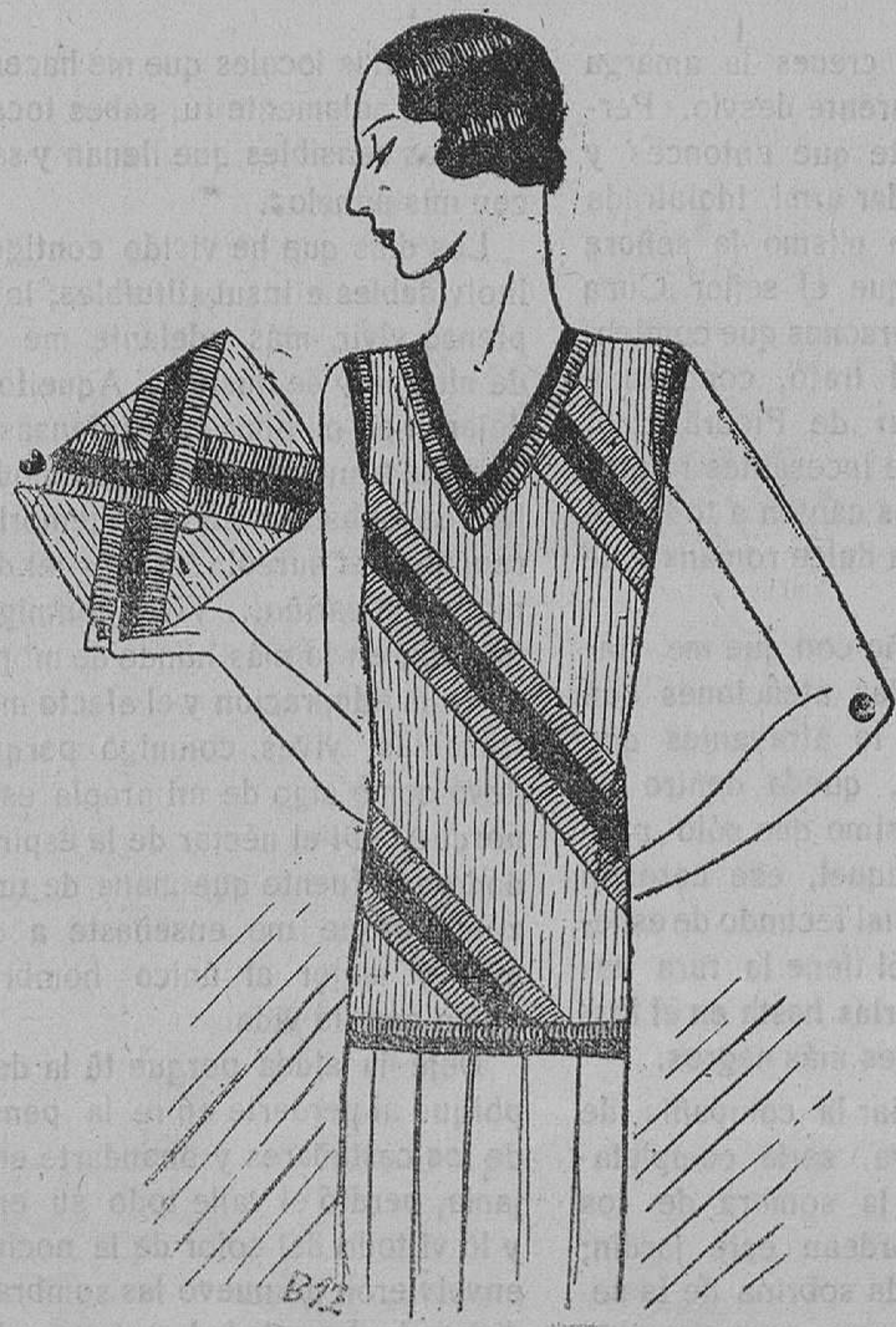
Pull over de lana beige y colores verde y rojo, cartera haciendo juego.

En cuanto a las formas, se observa que son anchas, de vuelo. Algunos modelos tienen hasta cinco metros de vuelo. Esta anchura se disimula por un hábil corte de la falda. Los bajos son siempre asimétricos; la falda baja por un lado al ras del suelo, sin tocarlo; o bien desciende igualmente hasta casi tocar al suelo por detrás. En la falda se usan unos volantes, en cuatro o cinco filas. Hay volantes que arrancan de las caderas. A veces se coloca un volante a unos cuantos centímetros por debajo de la cintura, dibujando una especie de basquiña.